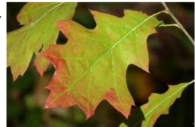
Blad Amerikaanse eik