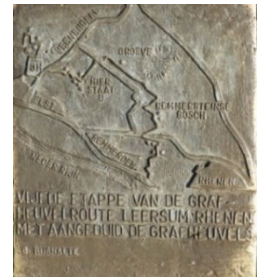
Informatie bij de grafheuvel

Na een poosje zie je bij een T-splitsing links drie grafheuvels liggen. Zie beschrijving op het paaltje aan je linkerhand. Op de hele Utrechtse Heuvelrug zijn honderden grafheuvels bekend, maar het merendeel is helaas in vroegere tijden leeggeroofd of beschadigd.