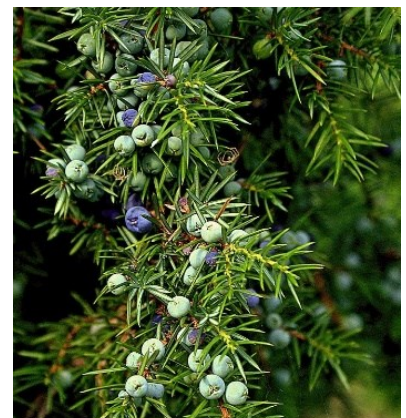
Bessen van de jeneverbes

De bessen zijn bekend als kruidige smaakmaker van jenever en gin en in de keuken als toevoeging bij marinades, zuurkool en gebraden gevogelte en sommige soepen.