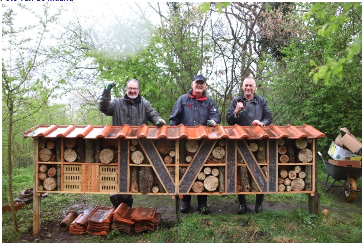
IVN is blij met het nieuwe insectenhotel in Diddersgoed