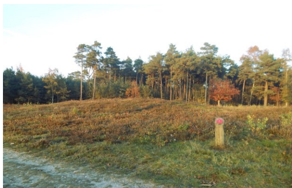
Grafheuvel op Plantage Willem III

Hier liggen een aantal grafheuvels uit de Bronstijd (2000-800 voor Chr.) Op de hele Utrechtse Heuvelrug zijn honderden grafheuvels bekend, waarvan het merendeel helaas in vroegere tijden leeggeroofd of beschadigd is. De grafheuvels hier heeft men kunnen dateren aan de hand van de gevonden scherven. De bewoners werden in die tijd meestal gecremeerd en hun resten werden in een urn onder de heuvel begraven. Deze heuvels waren destijds veel hoger en vaak omgeven door een palenkrans.