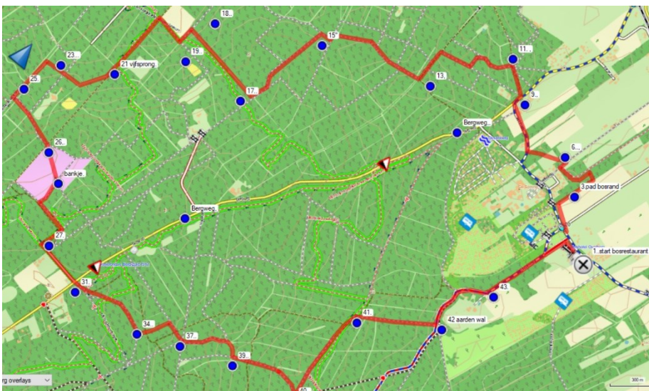
Veens Buitennommetje 8 de Hazenberg