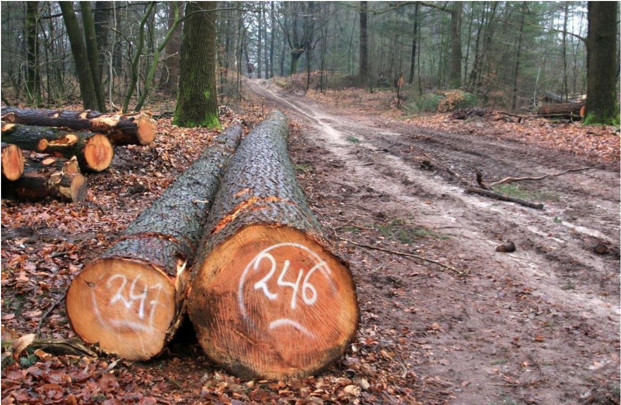
Douglasstammen wachtend op transport