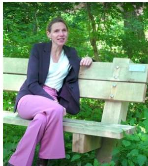
Gedeputeerde Mirjam Sterk

De provincie Utrecht maakt het voor iedereen mogelijk om subsidie aan te vragen voor het plaatsen van minimaal twee recreatiebankjes in het buitengebied, langs een wandelroute. Met deze subsidieregeling hoopt de provincie dat de beleving van de natuur vergroot wordt en dat meer mensen gaan wandelen. De ambitie is dat er 100 extra bankjes in het landelijk gebied bijkomen. Door meer rustpunten te creëren wordt het wandelen aantrekkelijker en wordt het gemakkelijker om een langere wandeling te maken. Meer informatie via deze link.