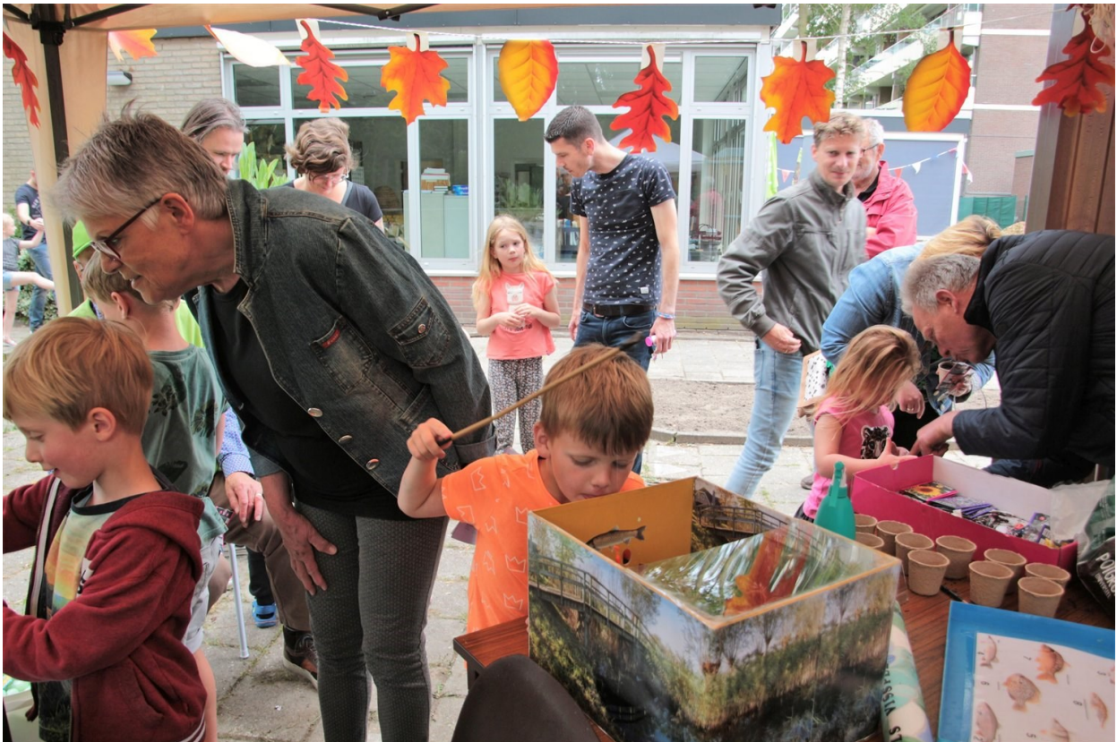
Impressie van de open dag op de Groenhof