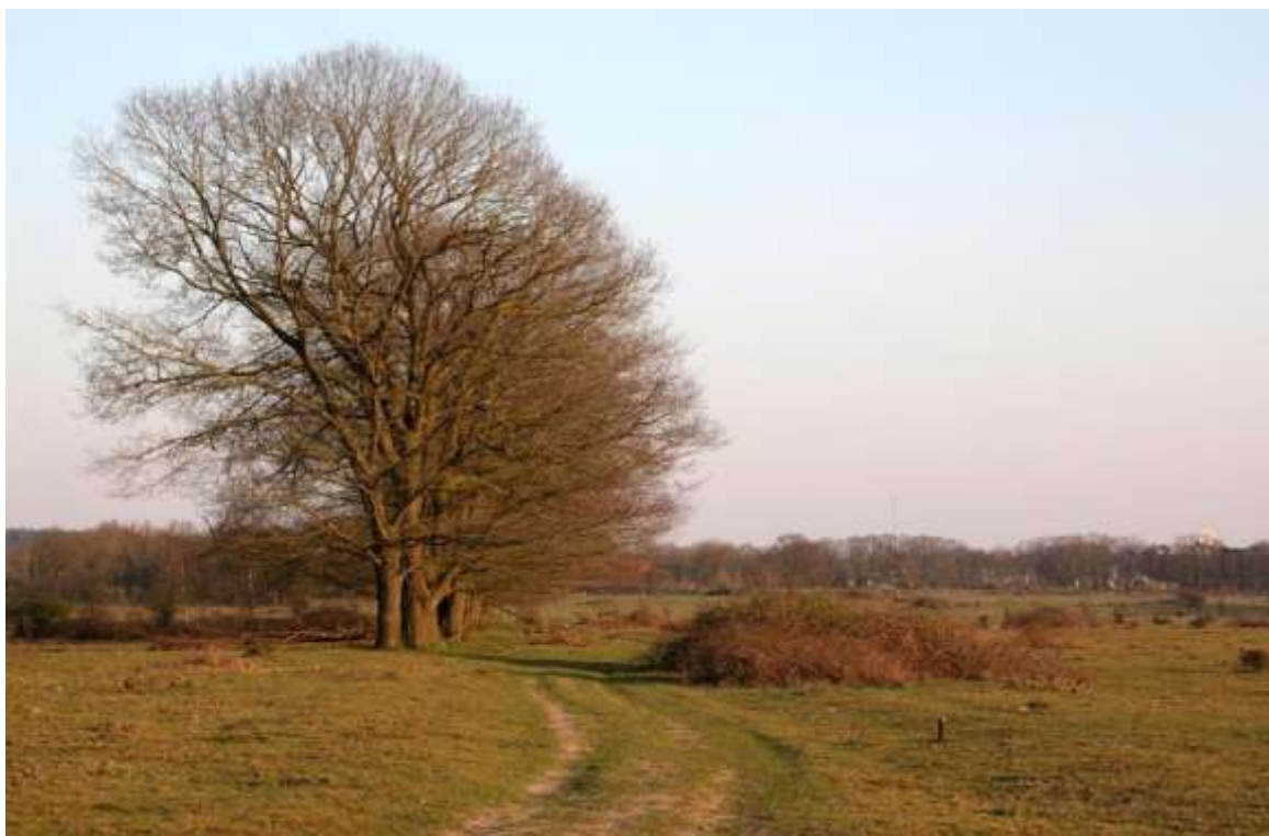
Plantage Willem III