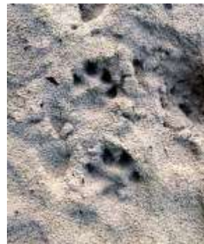
Wolvensporen Wekeromse zand