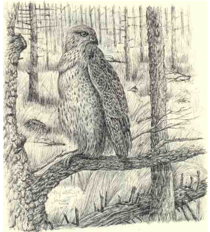
Tekening Alie van Eijk