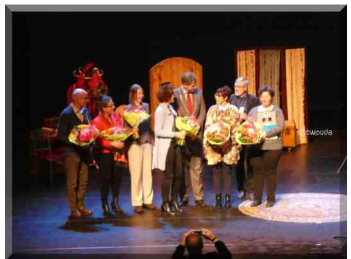
Alle genomineerden en de winnaars in de bloemen