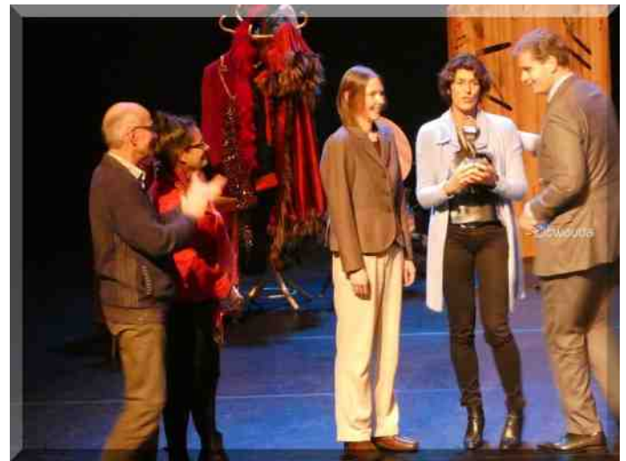
Applaus voor de winnaars.

Natuurlijk behoorde niet alleen IVN tot de genomineerden, maar ook de Stichting Verder met Taal en de Kledingbank. Allemaal vrijwilligersorganisaties die zich inzetten om mensen erbij te houden, deel te laten zijn van onze gemeenschap.