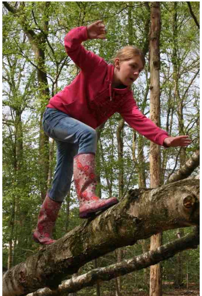
Boomklimmen: Alle kinderen naar buiten.