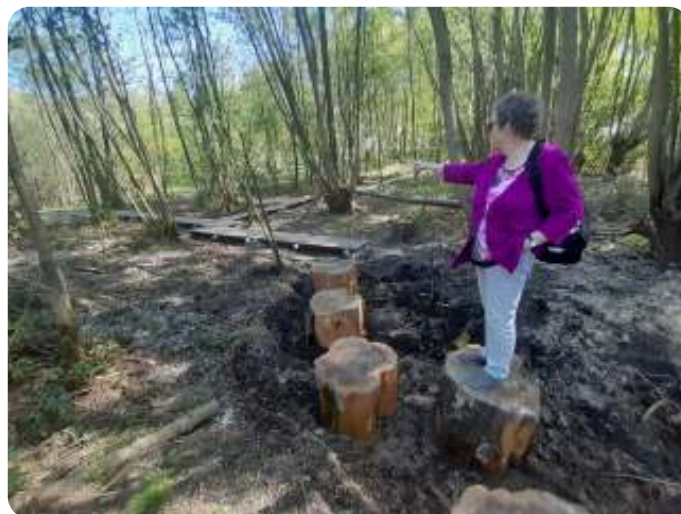
vlonderpad door nat bosgebied