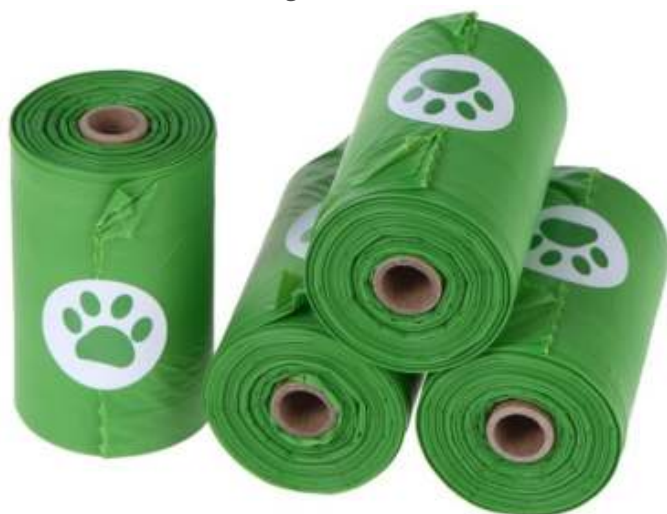
Biologisch afbreekbare en composteerbare poepzakjes van maïszetmeel

Sommige consumenten zullen de claim op de verpakking, dat biologisch afbreekbaar plastic niet schadelijk is voor de natuur, zonder meer geloven. Het kan zijn dat dit een van de redenen is waarom de hondenpoepzakjes, van inhoud voorzien, in de berm en tussen de struiken belanden. De zakjes zijn biologisch afbreekbaar - het staat erop - dus weggooiden kan geen kwaad voor de natuur, is misschien de overtuiging van deze mensen. In werkelijkheid wordt dit materiaal niet op natuurlijke wijze afgebroken en is dus milieuvervuilend. Door de claim op de verpakking wordt de hondenbezitter door de verpakkingfabrikant doelbewust op het verkeerde been gezet. De afbraaktijd van dit plastic is sterk afhankelijk van omgevingsfactoren als temperatuur, zuurstof, water en de hoeveelheid bacteriën en schimmels. Doorgaans gaan er vele jaren overheen voordat het weg is.