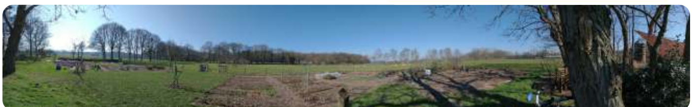
Panorama moestuin maart 2021