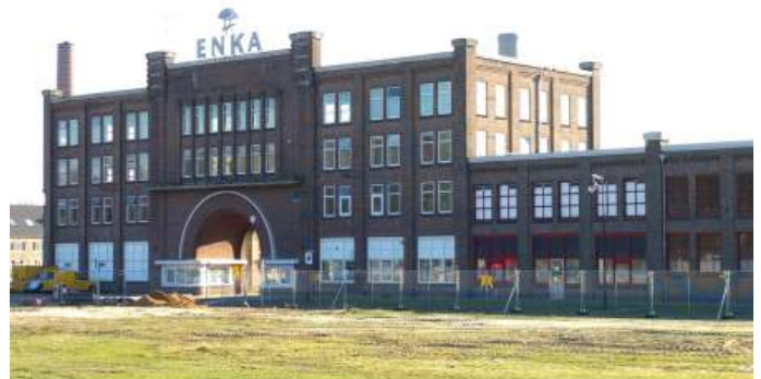
Het gerestaureerde Enka-poortgebouw

Na de sluiting van de kunstvezelfabriek in 2002 vond er een grondsanering plaats, waarna er op het terrein een nieuwbouwwijk werd gebouwd. Veel gifstoffen zijn de bodem ingezakt en hebben het grondwater bereikt. De vervuiling bevindt zich op een diepte van 20 tot 40 meter onder het maaiveld in een zandlaag en verplaatst zich langzaam in zuidwestelijke richting. Het heeft zich al via de wijk Maandereng richting de Rietkampen verspreid en vandaar uit zal het zich op den duur naar de Bennekomse Meent verplaatsen. Het grondwater bevat onder andere sulfaat, kankerverwekkende stoffen als pentachloorfenol, dioxines en pcb's. De inwoners van Ede ruiken af en toe een stank van waterstofsulfide (lucht van rotte eieren), een teken dat er nog veel vervuild water in de bodem zit.