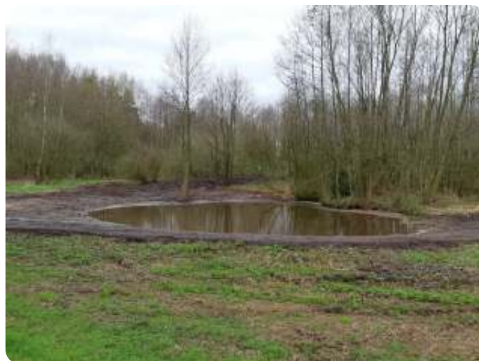
natuurlijke poel opnieuw aangelegd

Op de aanlooproute is inmiddels een Keltische boomkalender aangelegd en zijn bermten ingezaaid met een mengsel wat daar van nature thuishoort. Andere elementen zijn een blotevoetenpad, uitkijkposten, spinnenweb,