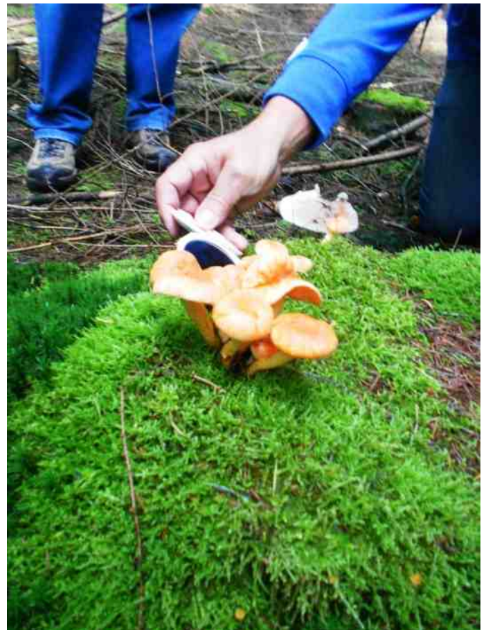
Spiegelkje bij paddenstoelen