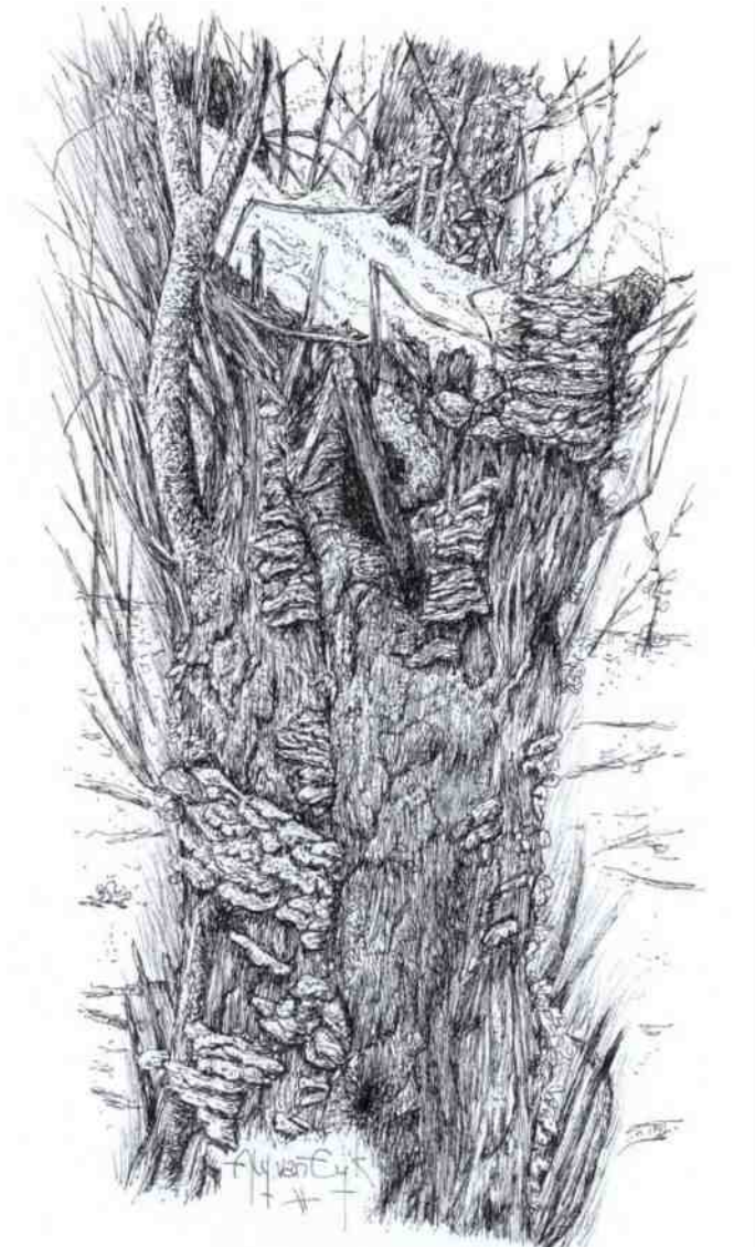
Afgezaagde boom met zwammen

Een van de grootste zoogdieren in ons land is de das. Niet iets wat je dagelijks tegenkomt. Dit jaar, 2015, is het jaar van de das. Beschermd, want 50 jaar geleden werd hij nog ernstig bedreigd in ons land, maar dankzij een geslaagde reddingsoperatie, zijn de aantallen en de verspreiding flink toegenomen. Bij mij in de omgeving zijn er ook dassenburchten, o.a. op Plantage Willem drie, tussen Elst en Rhenen. Hun burchten worden generaties lang gebruikt en kunnen eeuwenoud worden. De burcht heeft drie tot tien ingangen. Voor de ingangen liggen vaak hopen aarde en oud nestmateriaal. Dat zijn varens, droog gras en bladeren. Het nestmateriaal wordt tussen kin en voorpoten ingeklemd een achterwaarts de gangen in gebracht. De toiletten zijn ondiepe gegraven putten waar de uitwerpselen worden achtergelaten. Zo markeren ze het territorium. Dat is soms dertig tot vijftig hectaren groot.