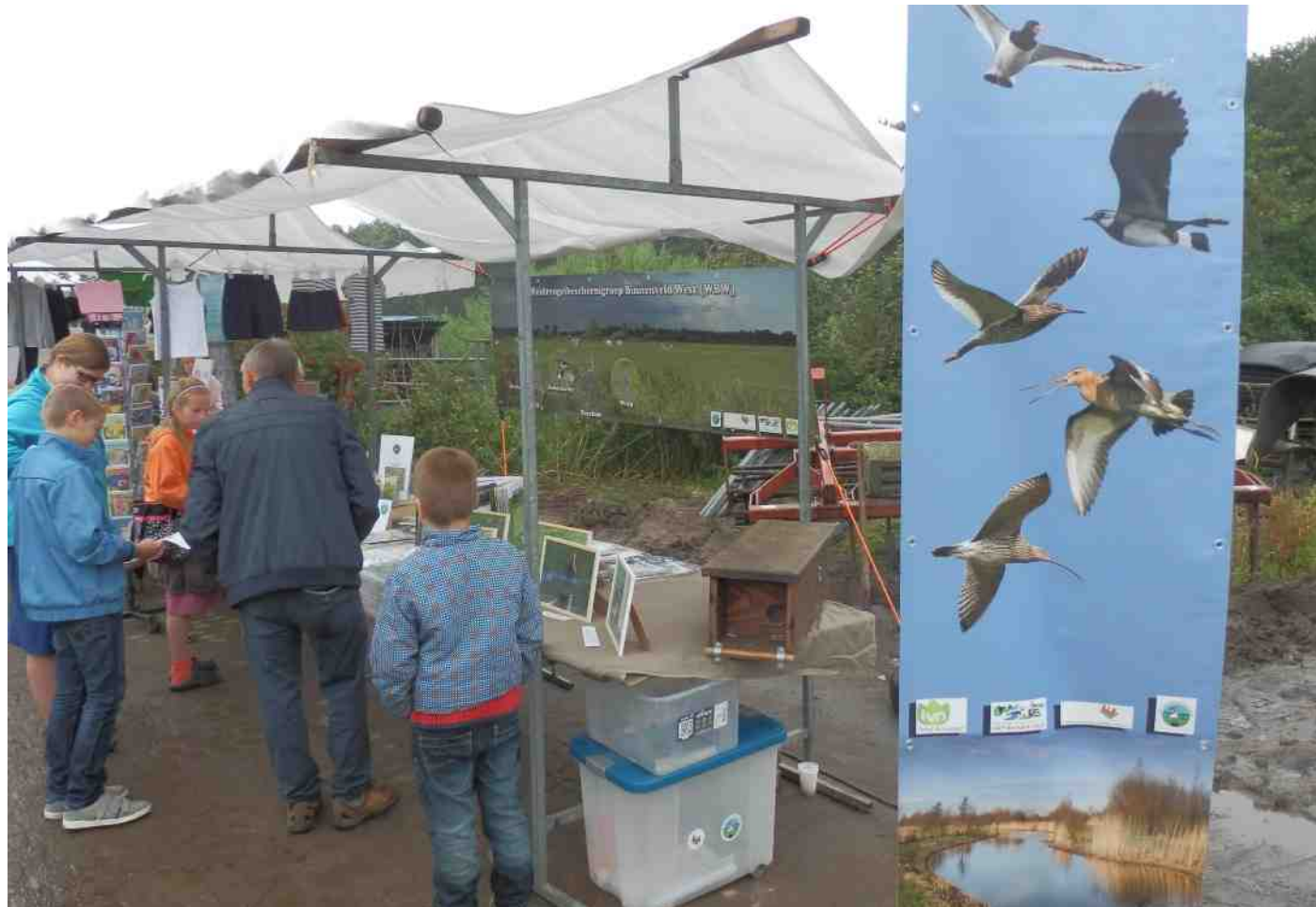
Stand werkgroep weidevogelbescherming