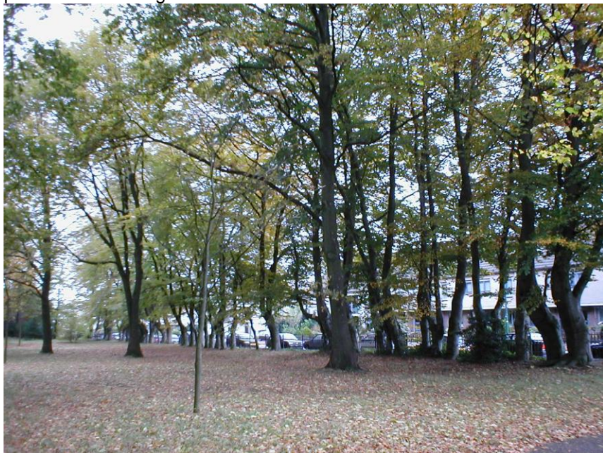
Beukenhaag bij het oude kerkhof aan de Weverij

met vaak de daarbij behorende vervanging of verwijdering van struiken en soms zelfs bomen. Wij geven dan de visie weer van hoe het IVN het graag ziet gebeuren. Hoewel we uiteraard niet altijd onze zin krijgen (geld speelt toch altijd een grote rol) kunnen wij toch wel spreken van een steeds groen bewuster wordende gemeente. Laat ik u eens een paar voorbeelden geven.