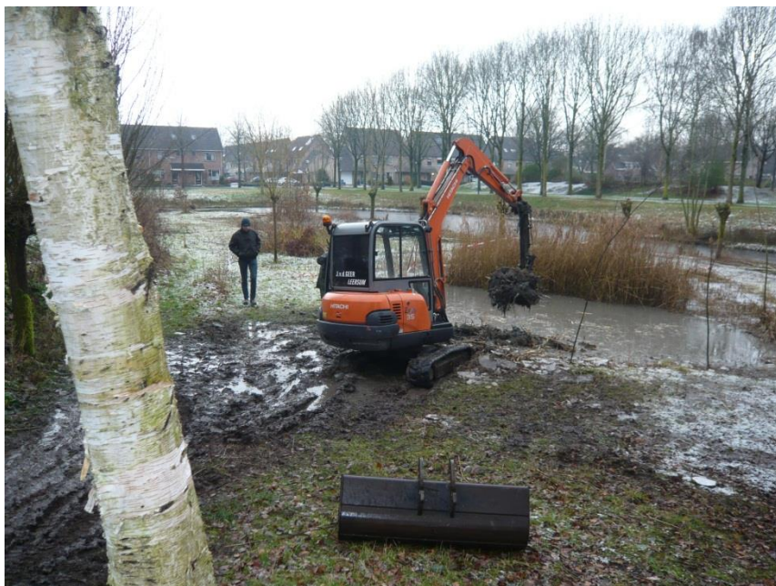
Marc Pul in actie samen met de kraanmachinist.

In het voorjaar zal het resultaat duidelijk worden met open water en oevervegetatie. U bent dan weer van harte welkom tijdens de openingsuren, de laatste zondag van de maand tussen 15.00h en 16.00h.