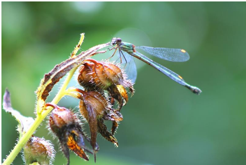
Houtpantserjuffer op uitgebloeid akkerklokje van Bas Drost