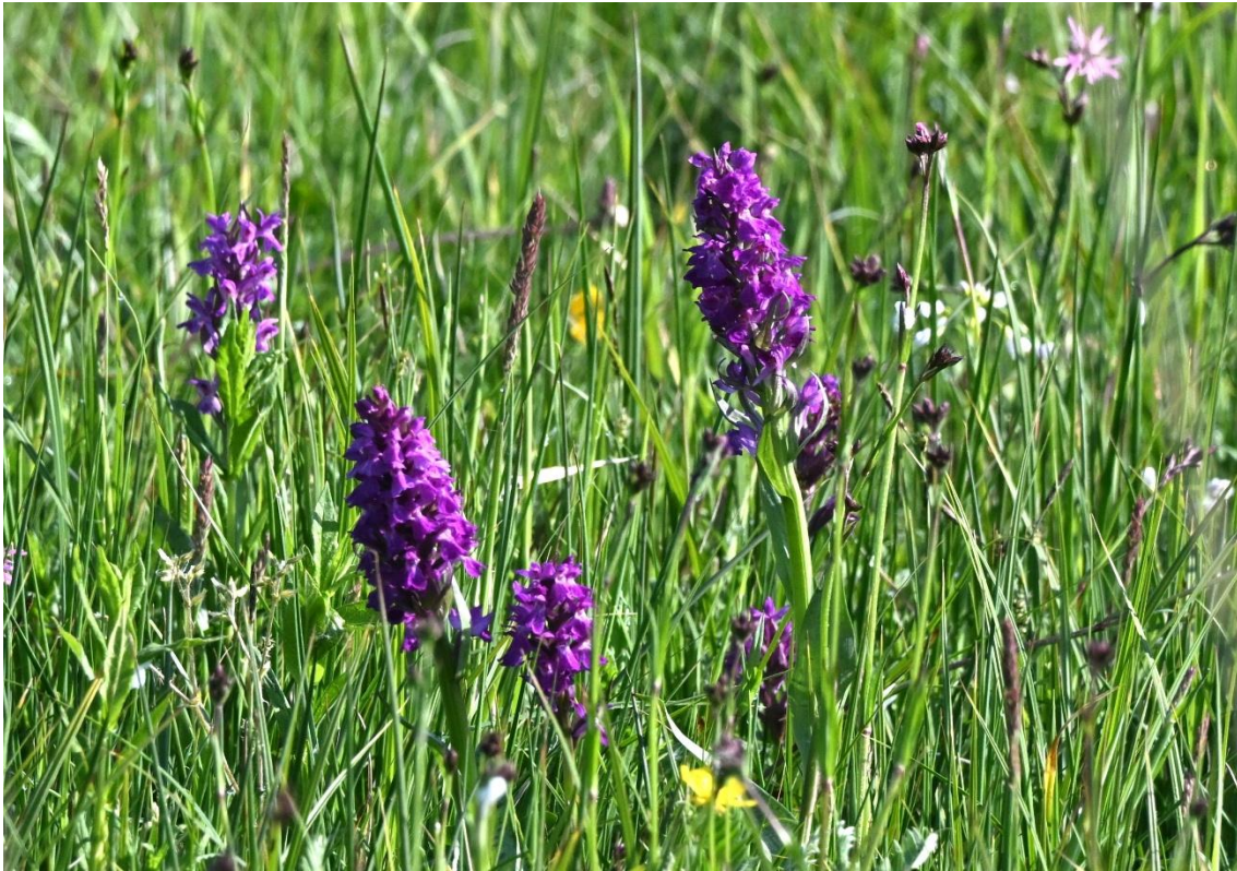
Foto 1: De gewone orchis die tijdens de wandeling op enkele plaatsen is aangetroffen.