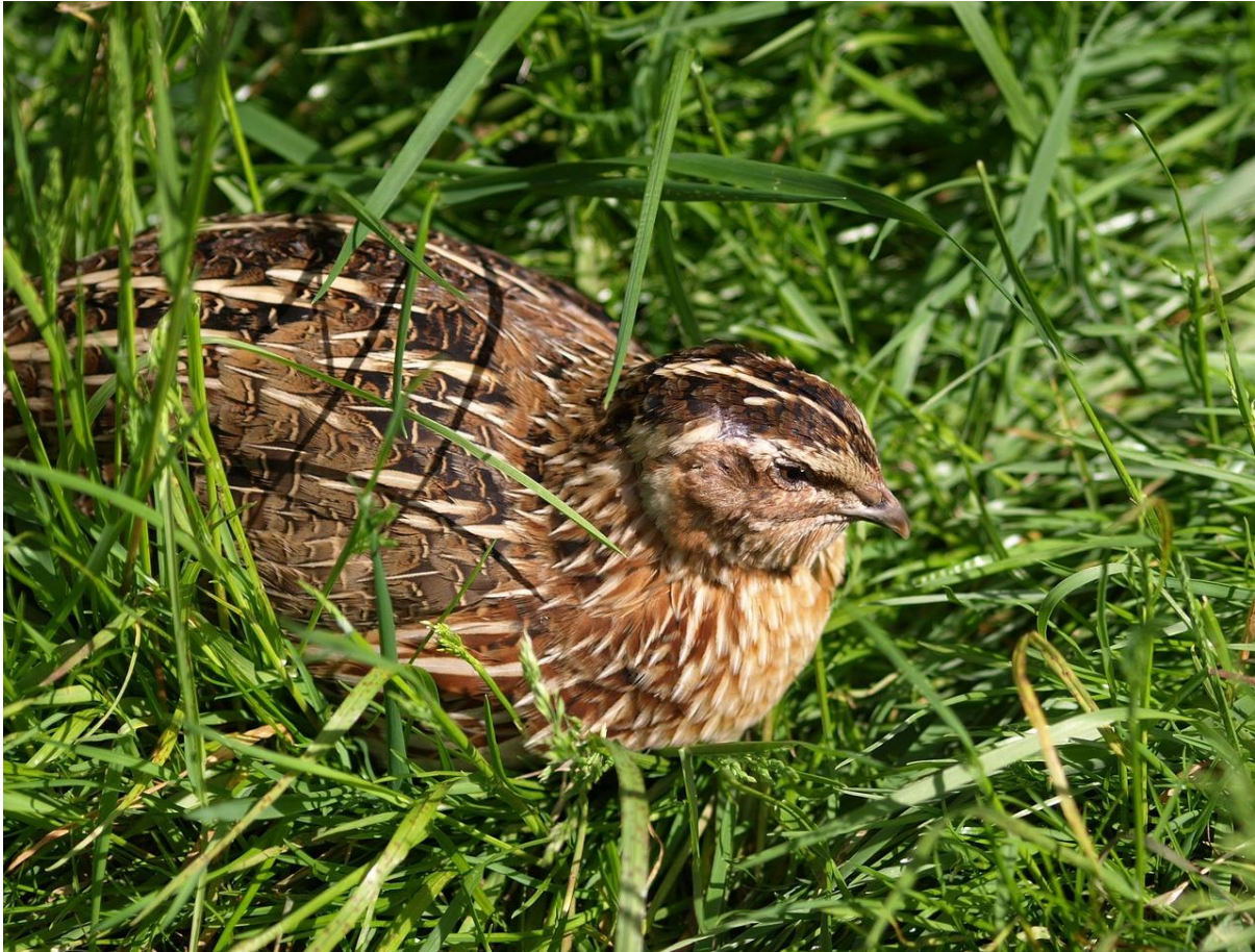
Foto 2: Foto van een kwartel zoals wij die hoorden in het Diessens Broek

We vervolgen onze route om het gebied. Gele kwikstaarten doemen op en ook de bonte vliegenvanger en de boompieper laten zich horen. Op de zandpad waarop we lopen, zien we een wolfspin lopen die een eicoon met zich mee draagt.