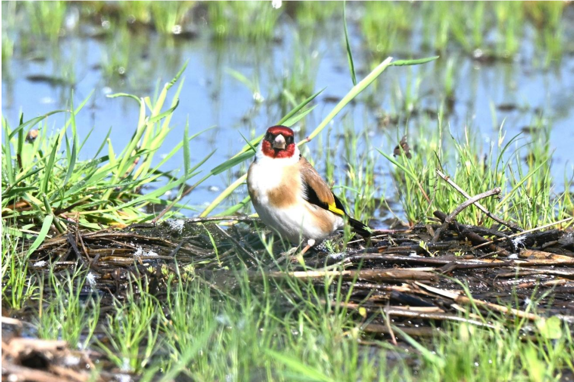
Foto 4: Foto van één van de putters die zich uitgebreid liet fotograferen.