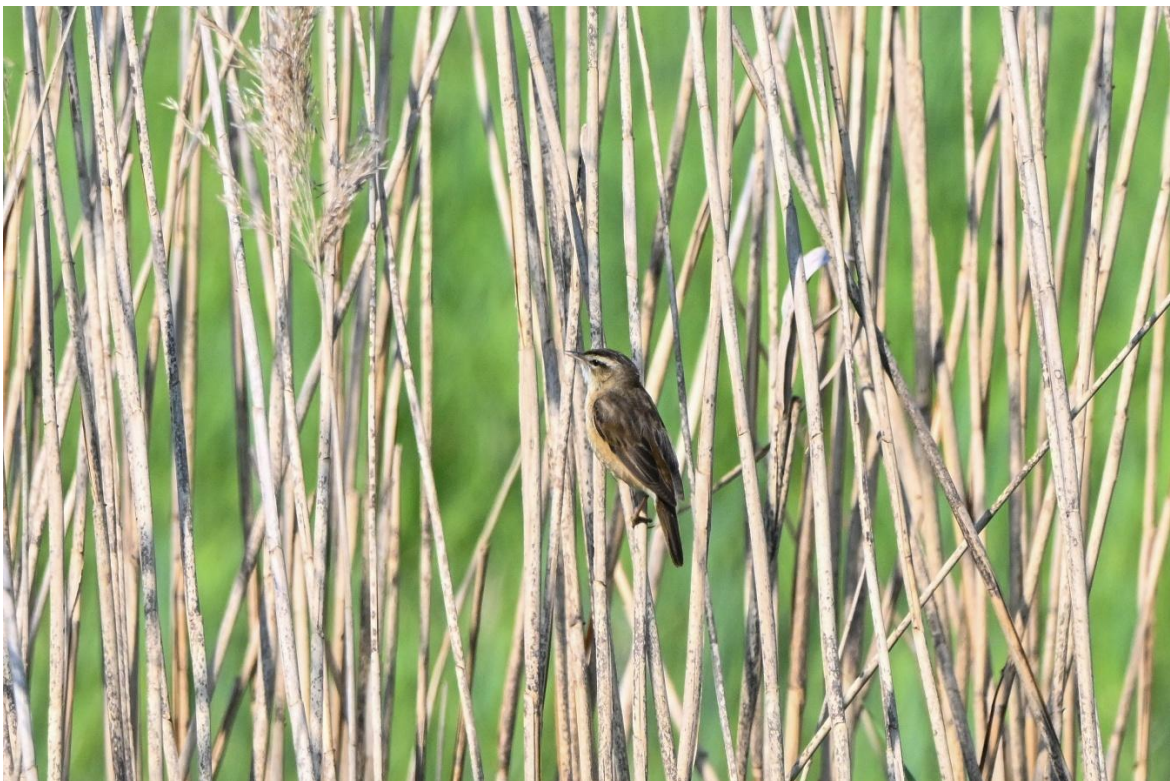
Foto 7: Foto van de rietzanger die luid en duidelijk laat weten dat hij er is.

Enmaal op de toren zoeken we in het gebied naar de bruine kiekendief en de spotvogel. We weten uit eerdere bezoeken waar ze ongeveer moeten wonen. Helaas de beide soorten worden door ons niet gezien. Wel horen we een rietzanger luidruchtig zingen.