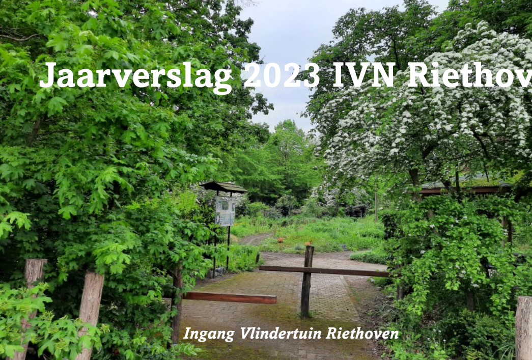
Ingang Vlindertuin Riethoven