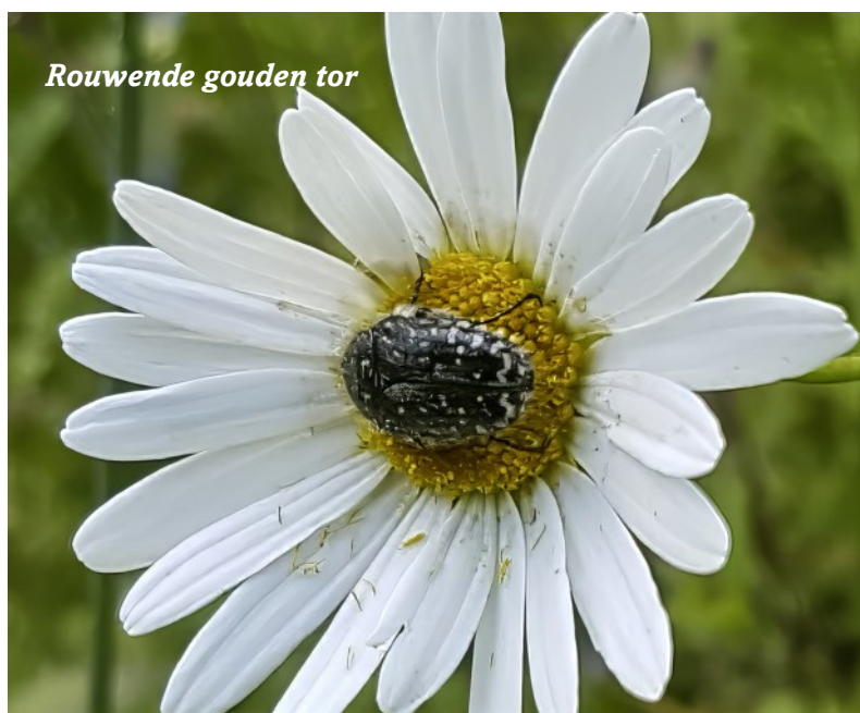
Rouwende gouden tor

In 2023 hebben we, met een groepje geïnteresseerden, acht keer genachtvlinderd. Dit jaar zagen we 11 nieuwe soorten nachtvlinders. Vooral het zeer zeldzame Wit weeskind was een bijzonder leuke verrassing. (zie foto bovenaan de volgende pagina).