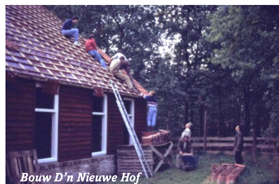
Bouw D'n Nieuwe Hof

Uiteindelijk werd besloten om een eigen onderkomen te gaan bouwen. In maart 1984 werd begonnen met de bouw ervan aan de Bosstraat.