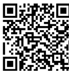
QR: Jan's Natuurweetjes