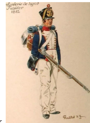
Soldaat uit het Napoleontisch leger

In dit gebied zijn veel sporen van een legerplaats van Napoleon gevonden. Vijftien meter voordat de route linksaf gaat is aan de rechterkant een kuil te zien. Hierin werd door de legerkoks het eten bereid. Er liggen in de omgeving verschillende van die "kookputten".