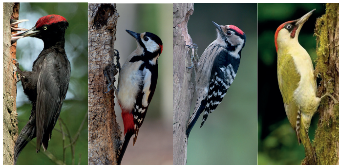
1. Zwarte specht 2. Grote bonte specht

In deze laan treft men in veel bomen een spechtengat aan. Zo'n broedholte kan jaren oud zijn en wordt ook wel eens bewoond door een vleermuis-, spreeuwen-, kauwen- of boomklevergezin dat de opening naar believen aanpast.