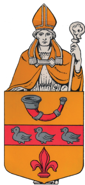
Het wapen van de gemeente Waalre

In 1866 kregen de beide kerkdorpen Aalst en Waalre een treinverbinding aan de spoorlijn Eindhoven-Hasselt. Na opheffing van de lijn in 1959 rest nu nog café-restaurant "Het Stationskoffiehuis" bij de plaats van het voormalige station.