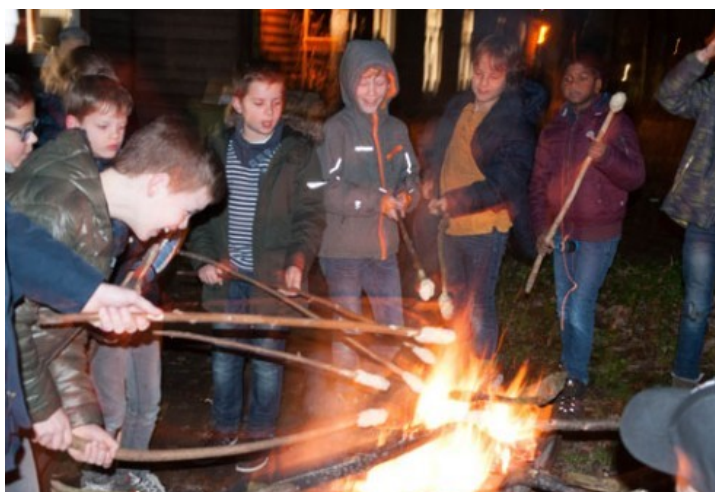
Kerstviering Jeugd IVN 2017

Door de tijd heen wisselden het aantal jeugdleden, maar het enthousiasme waarmee de leiding de belangstelling voor de natuur bij de jeugd op wist te wekken bleef.