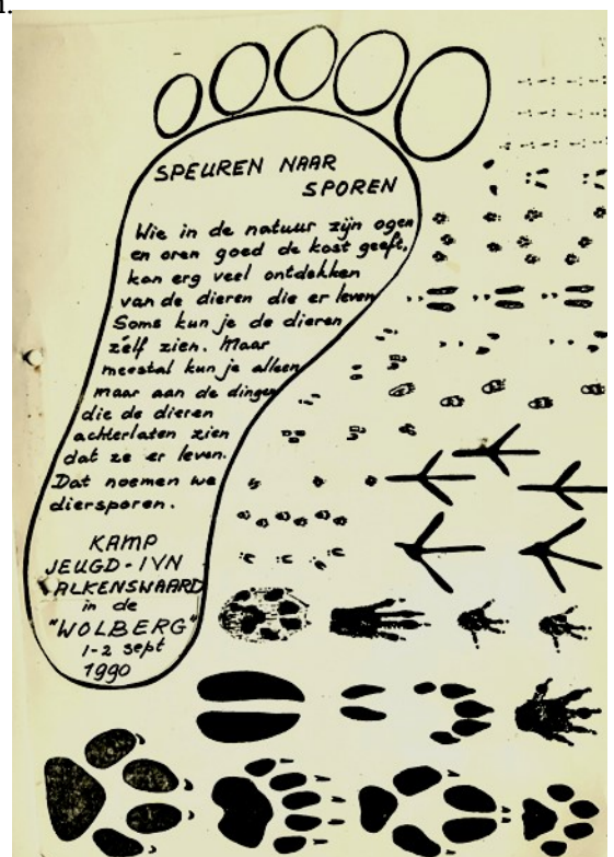
Jeugd IVN Kamp 1990

Overdag werd er een programma gevolgd en 's avonds zorgde de 'kookstaf' voor de maaltijden.