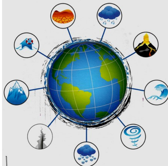
Affiche Jeugd IVN Binnendag 2011