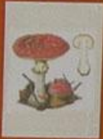
vliegenzwam (is een amaniet)