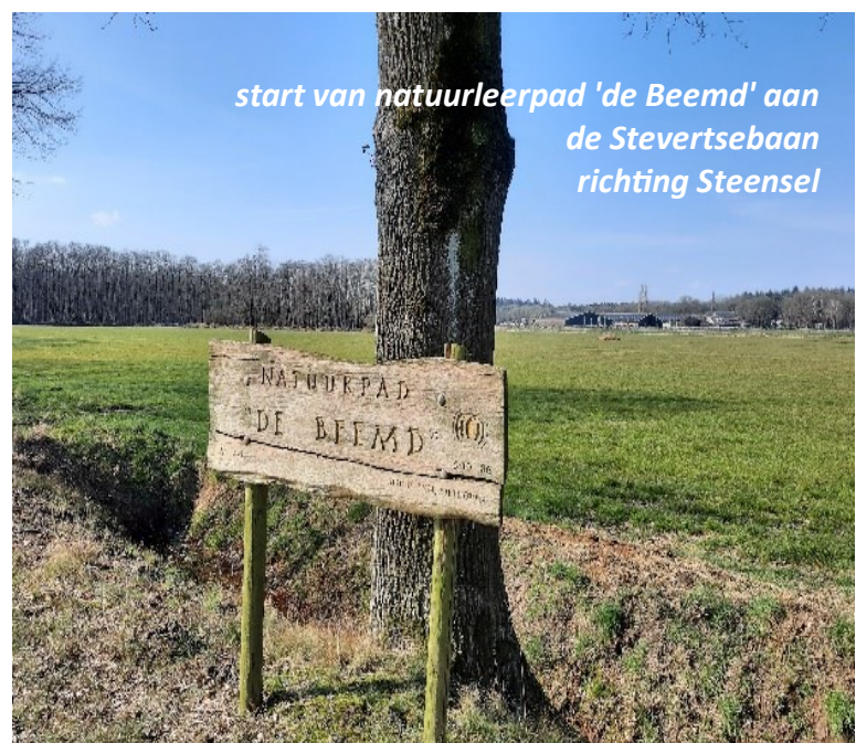
start van natuurleerpad 'de Beemd' aan de Stevertsebaan richting Steensel

Het voorjaar was te nat en daarom werd de geplande locatie de Schuffert vervangen door het