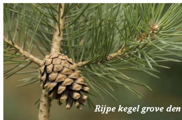
Rijpe kegel grove den