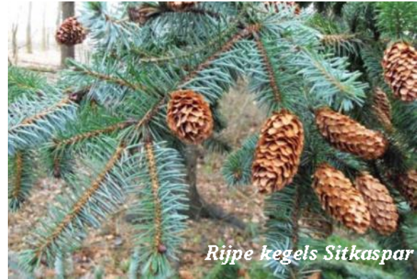
Rijpe kegels Sitkaspar

met een koker van licht doorlatend plastic. Dat houdt de knabbelende reeën op afstand. Na een jaar of zes kunnen de plastic hulzen weg. Verder hebben de bomen alleen water gekregen in het jaar van aanplanten. De bomen zijn al begin 2019 aangeplant als onderdeel van een pilotproject met 1800 bomen van elf verschillende soorten.