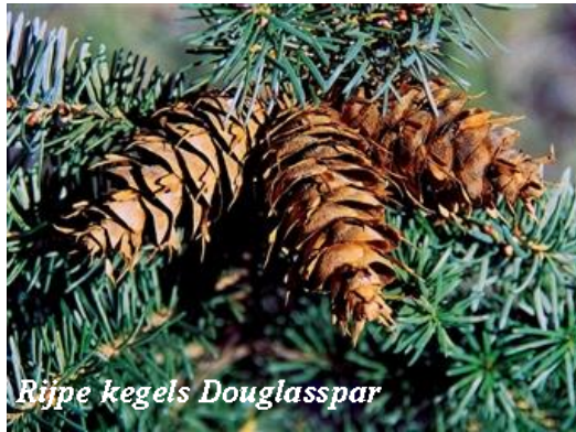
Rijpe kegels Douglasspar