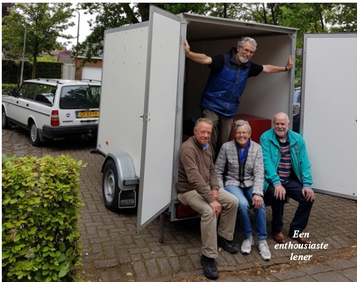
Een enthousiaste lener