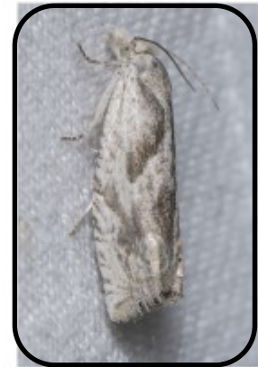
Zalkleurig knoopvlekje ( Eucosma metzneriana ) Bernard