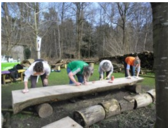
NL doet: dames zetten de banken in de verf.