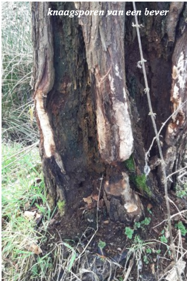
knaagsporen van een bever

staan, maar struikwerk weggehaald, zodat daar weer een ander soort diversiteit in het landschap ontstaat. Met een grotere groep vrijwilligers hebben we een groot stuk bos ingeplant met nieuwe boompjes. Aan deze activiteit hebben we ook weer een nieuw lid overgehouden die onze groep met enthousiasme is komen versterken.