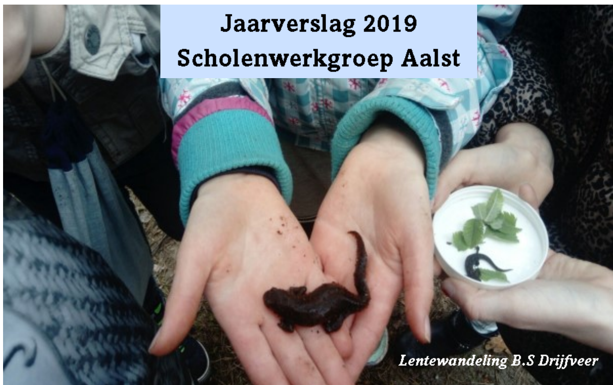
Lentewandeling B.S Drijfveer

Alle basisscholen in Aalst (De Drijfveer, De Meent, OBS Ekenrooij en de Christoffelschool) hebben deelgenomen aan één of meer van onze projecten.