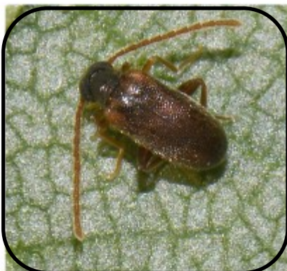
Schijnsnoerhalskever ( Euglenes oculus ) Hans