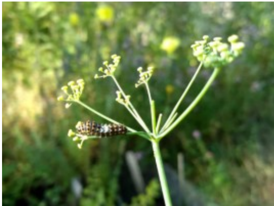
Bloeiende venkel met koninginnenpage-rups