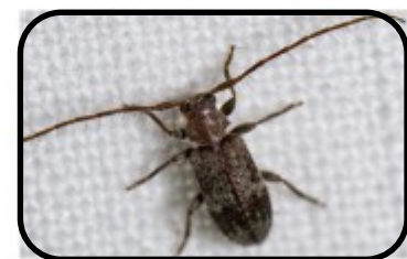
Eiken-ruigsprietboktor ( Exocentrus adpersus ) Bernard