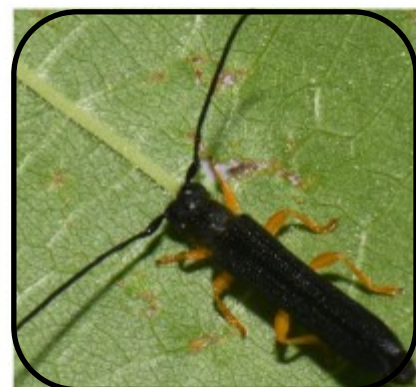
Hazelaarboktor ( Oberea linearis ) Hans