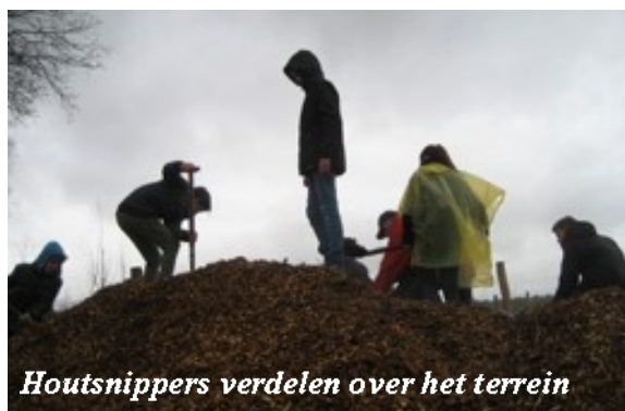
Houtsnippers verdelen over het terrein