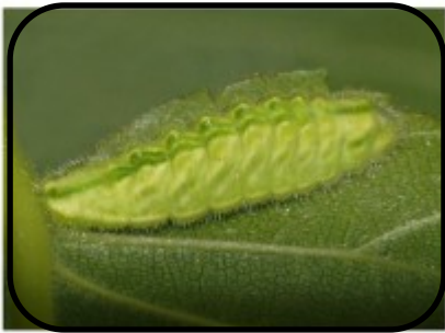
lepenpage ( Satyrium w-album ) Mirriam