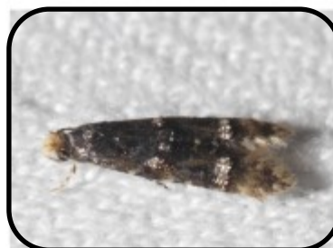
Azuurblauwmot ( Stenoptinea cyaneimarmorella ) Ferry Duyvelaar