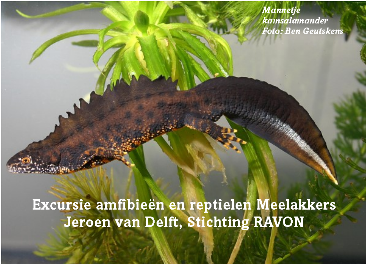
Mannetje kamsalamander