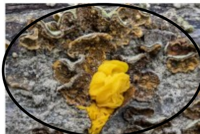
Gele hersentrilzwam ( Tremella aurantia ) Bernard