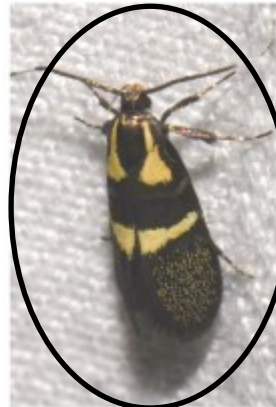
Schorsvaandeldrager ( Dasycera oliviella ) Hans