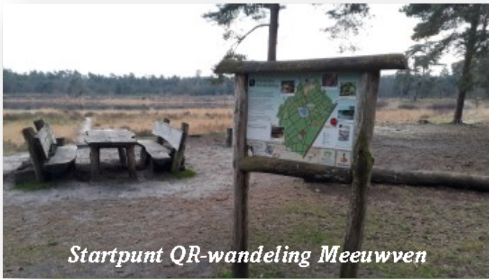
Startpunt QR-wandeling Meeuwven