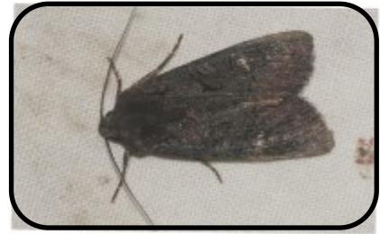
Zwarte witvleugeluil ( Aporophyla nigra ) Mirriam