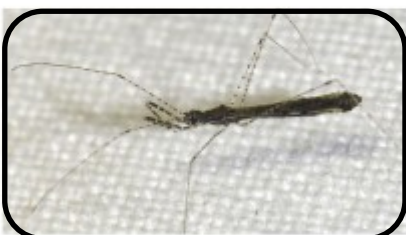
Schaarse muggenwants ( Empicoris rubromaculatu ) Hans