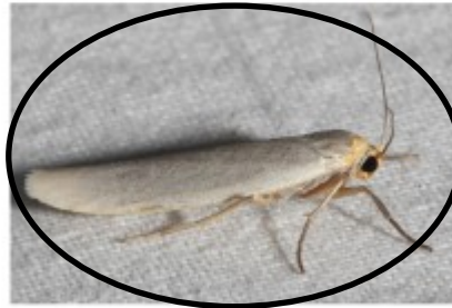
Vaal kokerbeertje ( Eilema caniola ) Ferry Duyvelaar