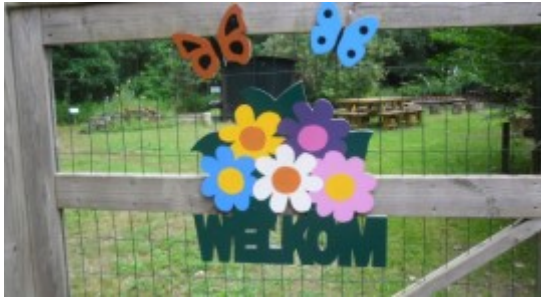
Nieuw welkomstbord op de poort