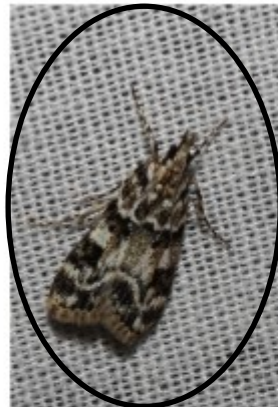
Zwartvlekgranietmot ( Eudonia delunella ) Frans Verhoeven