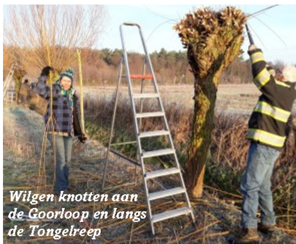
Wilgen knotten aan de Goorloop en langs de Tongelreep

Dit is gerealiseerd samen met de gemeente Waalre en ondersteuning van het Brabants landschap en de provincie. Het heeft de landschappelijke- en natuurwaarde een flinke impuls gegeven. De IVN Natuurwerk-