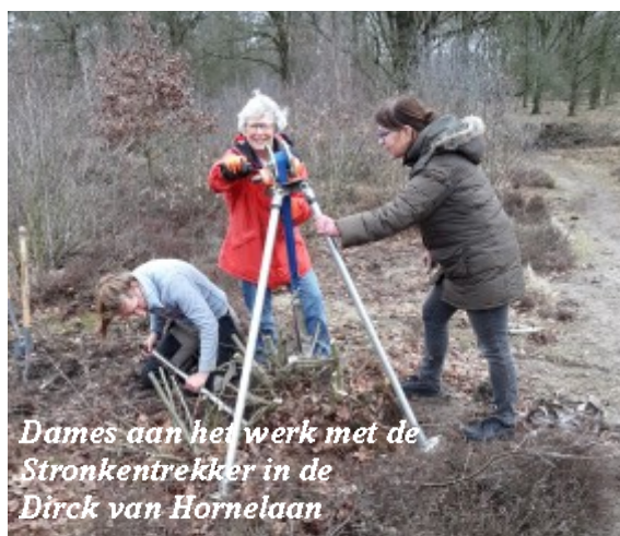
Dames aan het werk met de Stronkentrekker in de Dirck van Hornelaan