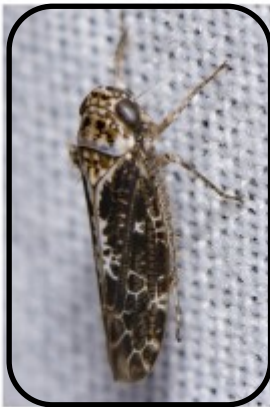
Allygus maculatus (Dwergcicade) Bernard