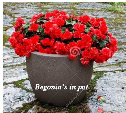
Begonia's in pot