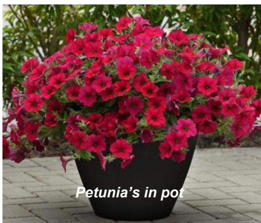
Petunia's in pot

Het was een bosachtige omgeving en regelmatig kwam er ook een eekhoorn iets van zijn gading halen. Pinda's, maar ook kleine paddenstoeltjes (uit de supermarkt) waren favoriet! Hij had verschillende privéoptrekjes hoog tegen de boomstammen, met een eigen balkonnetje waar hij stevast op zijn gemak ging zitten genieten van zijn vangst! Een tapijt van lege pindadoppen op de grond achter latend. Er stonden een paar dichte struiken die door de diverse vogelsoorten goed gebruikt werden als uitkijkpost, voordat ze op de voe-