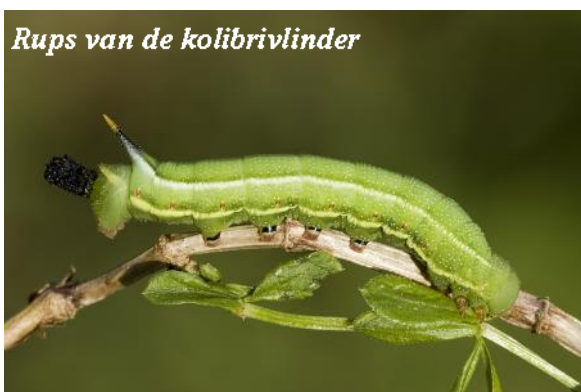
Rups van de kolibrivlinder

De belangrijkste vorm van verdediging tegen vijanden is de onopvallende camouflagekleur. In rust bevindt de vlinder