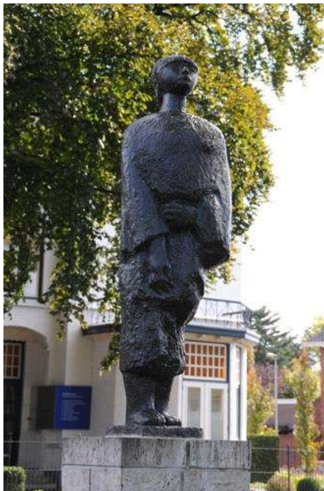
Verzetsbeeldje "de onverzettelijke vrouw"

redelijk goed bewaard zijn gebleven. Het pand "Brownies en Downies" is helemaal verbouwd, maar zo prachtig ingepast, dat het naadloos aansluit bij de naastgelegen panden. Het "Lodewijkskerkje", destijds gebouwd in opdracht van Lodewijk Napoleon, kennen wij als het protestants kerkje. Tegenwoordig wordt het gebruikt als trouwlocatie. Een lief beeldje van een jong stelletje past hier ontroerend mooi bij. Het witte gebouw dat nu de "Viertand" heet, was destijds de pastorie. Vele malen groter dan het kerkje, maar dit was tevens gemeenschapshuis voor de protestanten.