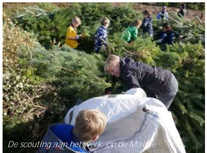
De scouting aan het werk - op de Malpie