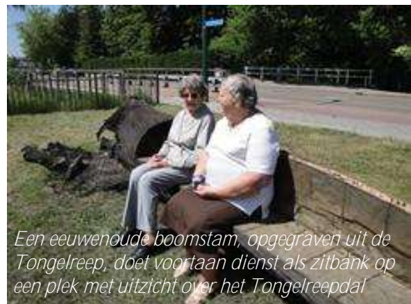
Een eeuwenoude boomstam, opgegraven uit de Tongelreep, doet voortaan dienst als zitbank op een plek met uitzicht over het Tongelreepdal