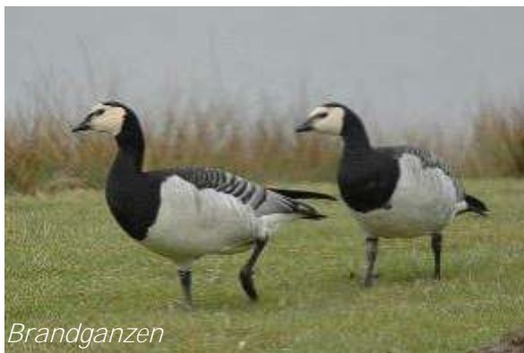
Valkenswaard, februari 2019. Vogelwerkgroep IVN Valkenswaard/Waalre.

telling. Van 's morgens 07.00 uur tot 's middags 14.00 uur hebben wij vanaf de Putberg in Soerendonk alle voorbij trekkende vogels geteld. Totaal zijn die dag door ons 34 trekvogelsoorten met in totaal 2414 vogels geteld.