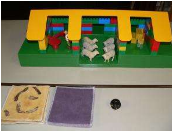
Post 1 "kom kijken op de hei"

gen specifieke gedrag en verstopplekjes! En lang niet alle spinnen maken een web. Ze kunnen wel allemaal een draad spinnen. De wespspin bijvoorbeeld, die zo'n mooi zigzag patroon in haar web heeft. Of de wolfspin , die haar eitjes aan haar achterlijf met zich meedraagt. En de doolhofspin , die een prachtig holletje maakt van spindraden, en daarin wacht tot er een prooi voorbij komt wandelen.