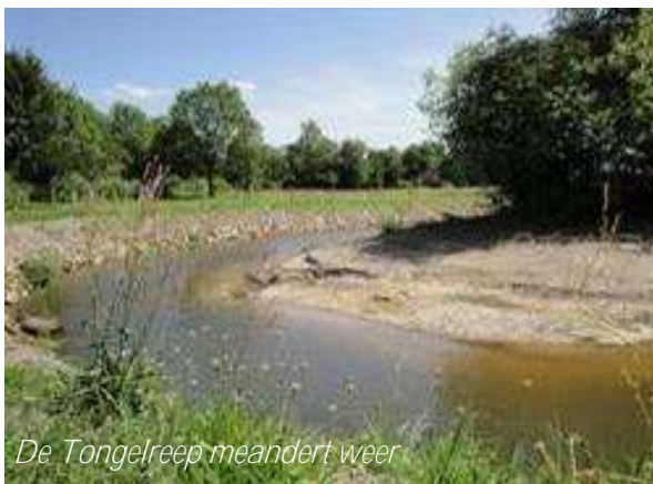
De Tongelreep meandert weer

Het belangrijkste is nog steeds de definitieve vaststelling van het Bestemmingsplan Buitengebied Waalre. Daar zijn wij al vanaf 2014 mee bezig. Het ligt nu bij de Raad van State die hopelijk binnenkort beslist over een aantal laatste beroepzaken (ingediend door de Provincie Noord-Brabant en door de BMF) zodat het plan