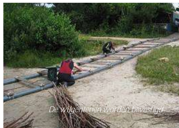
De wilgentenen worden bevestigd