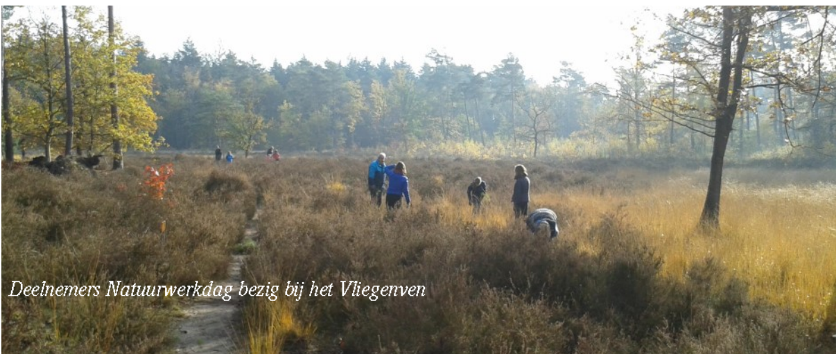
Deelnemers Natuurwerkdag bezig bij het Vliegenven