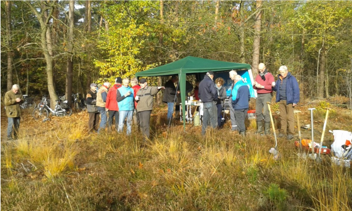
Warme soep voor alle deelnemers aan de Natuurwerkdag

voor hen ook nog wat ontspanning met een leuke verrassing aan het einde van de tocht in de vorm van zoekkaarten.