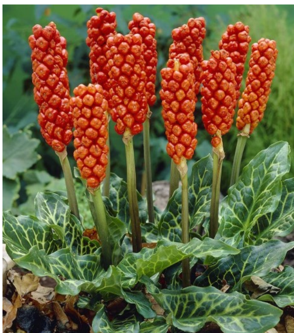
Uitgebloeide Italiaanse aronskelk