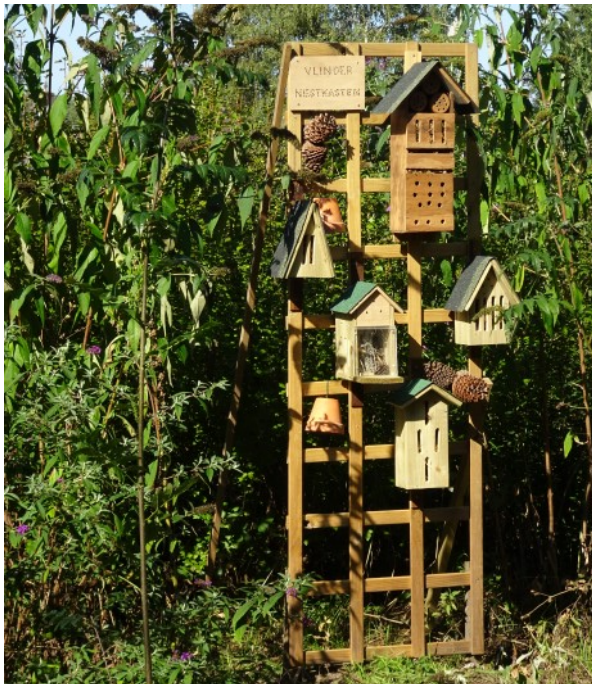
Een vlinderhotel door Jos

De gemeente heeft onze medewerking bij een project om samen met groep 7 van school bolletjes te planten op de Plaetse Walikerplein, waar de grond wordt voorberekt en waar voor wordt veiligheid gezorgd. Tevens komt de jongste groep bolletjes planten in de vlindertuin.