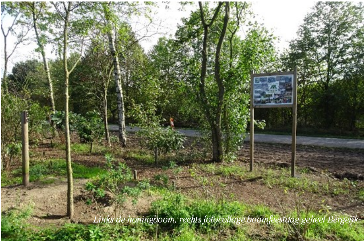
Links de honingboom, rechts fotocollage boomfeestdag geheel Bergetijk