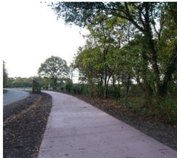
Het nieuwe fietspad