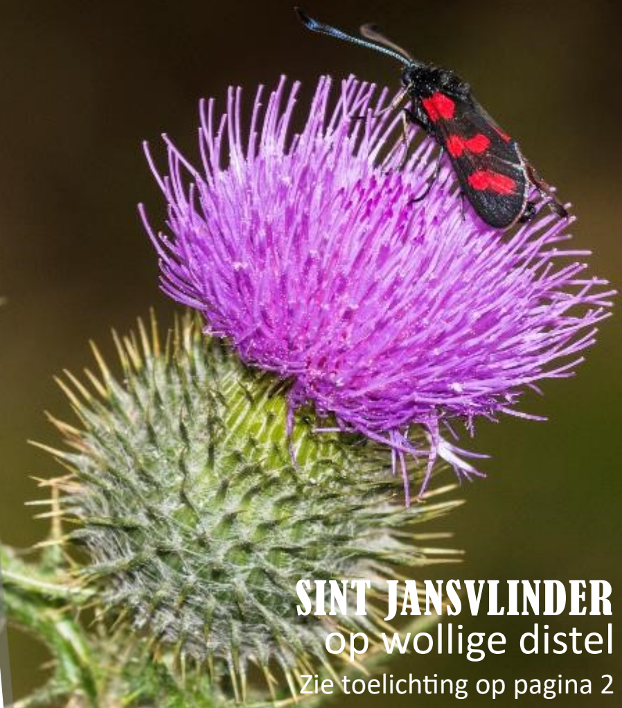
SINT JANSVLINDER op wollige distel Zie toelichting op pagina 2