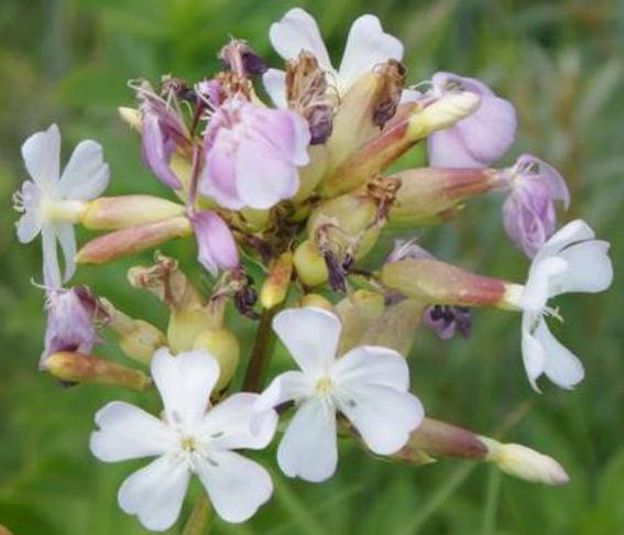
ZEEPKRUID ( Saponaria officinalis )