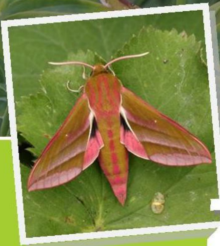
Groot Avondrood ( Deilephila elpenor )

NATIONALE NACHTVLINDER- NACHT OP 23 JUNI A.S.