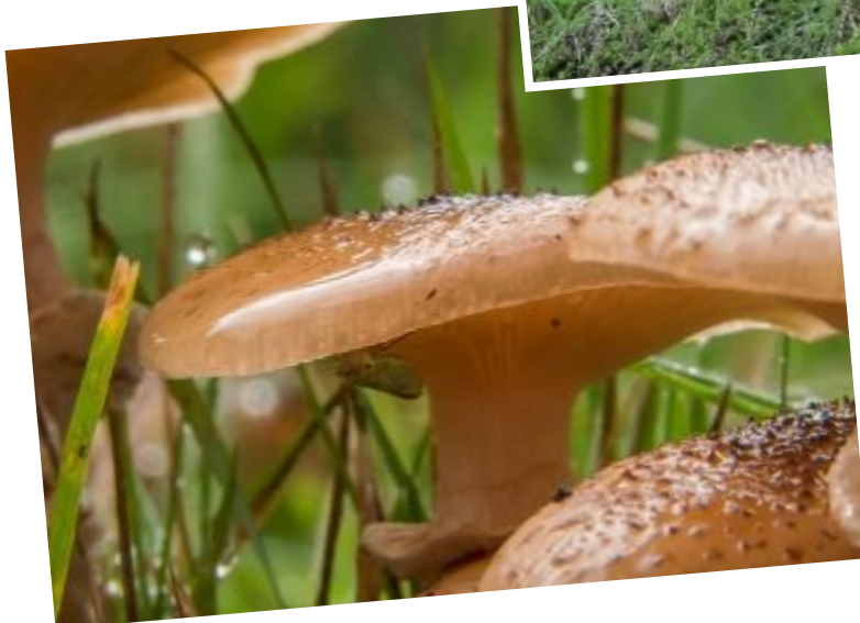
Een mooie macro-opname van een paddenstoelenhoed die de interessante details mooi laat zien