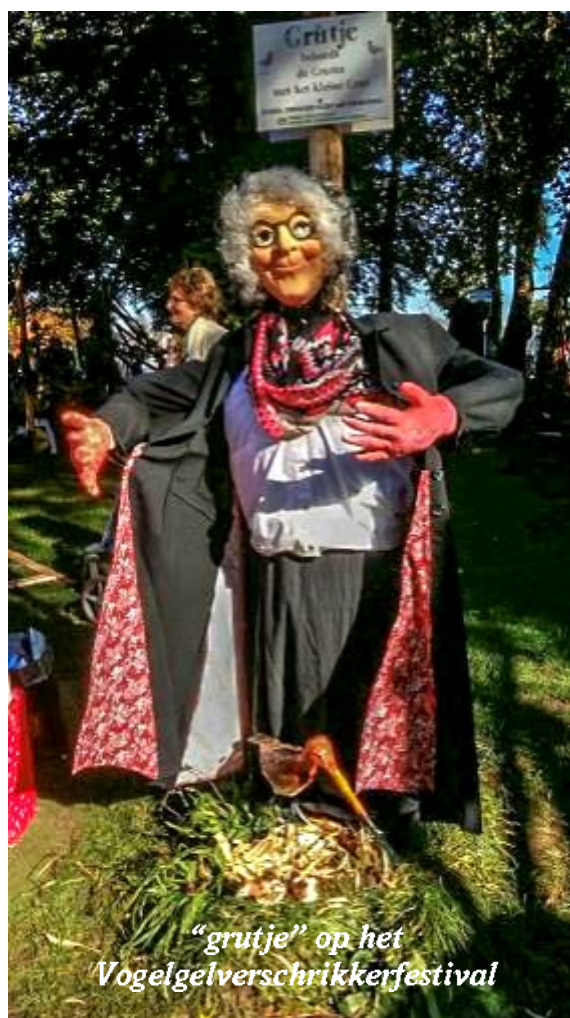
"grutje" op het Vogelgelverschrikkerfestival

van de activiteit. De invulling van een pubquiz tijdens een feestavond was voor de meeste aanwezigen compleet nieuw. Voor de filmavond wordt een tweede vertoning in het begin van 2018 gepland.