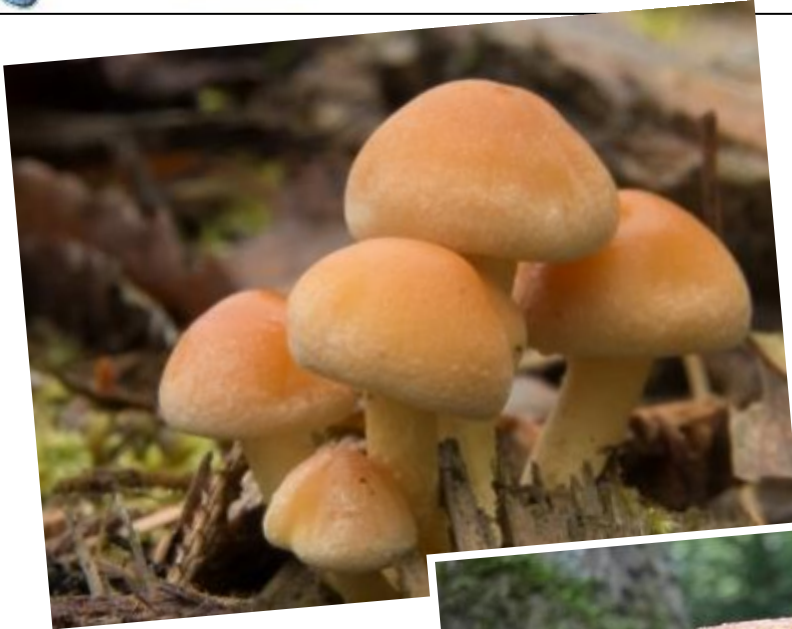
Rode zwavelkoppen in volle glorie op een van de kapvlaktes in het Leenderbos

Onderstaand zijn enkele opnamen afgedrukt die ons door Fotoclub 'Lumina' zijn toegezonden