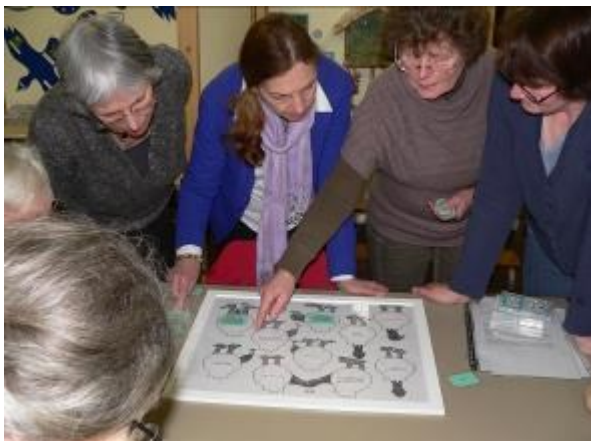
Bezoekers spelen een vogelspel