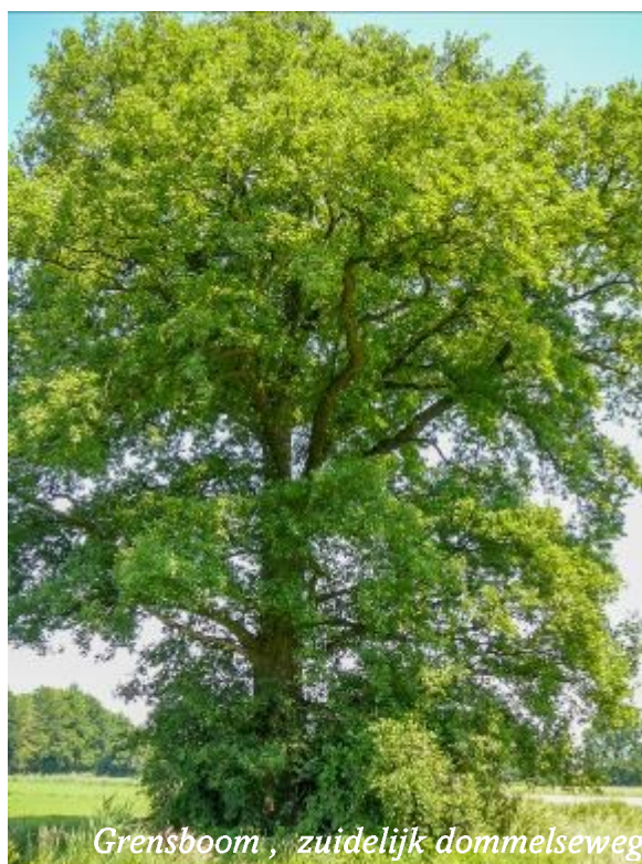
Grensboom, zuidelijk dommelseweg

1997. Wij hopen daarin het specifieke belang van monumentale- en waardevolle bomen nadrukkelijker terug te zien, niet alleen in onderhoud, maar ook in het aspect actieve bescherming, waardoor de speciale status van deze bomen benadrukt en zichtbaar gemaakt wordt. Tijdens de inmiddels gehouden raadsvergadering van 28 januari 2016 werd o.a. de vraag gesteld om monumentale bomen in het nieuwe groenstructuurplan te benadrukken. Dit werd aangenomen.