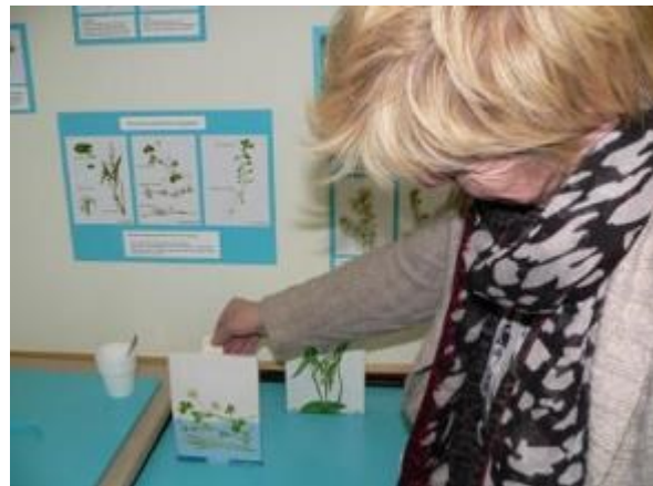
Sta eens stil bij de beek