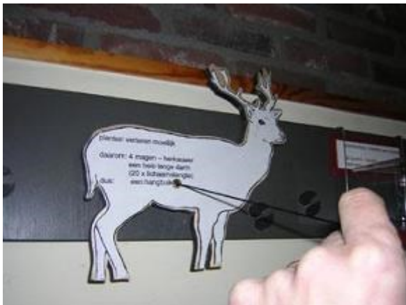
Zoogdieren ..... Hoezo?