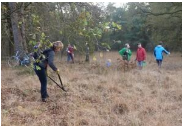
Personeelsleden van de Rabobank aan het werk op de heide