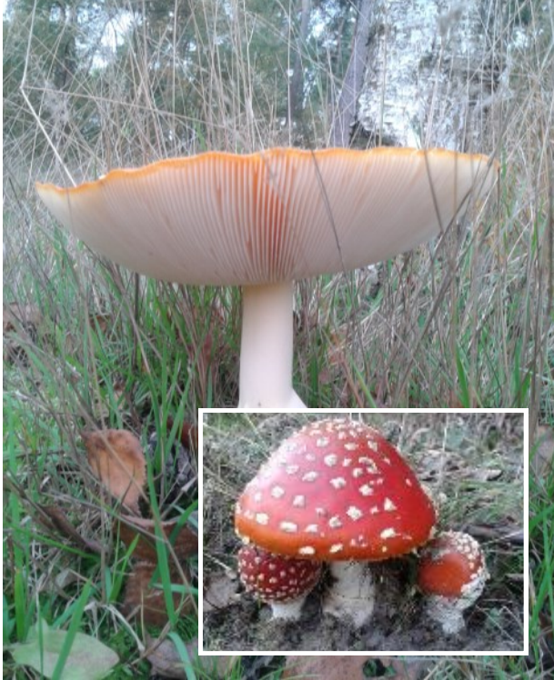
Plaatjes van de vliegenzwam