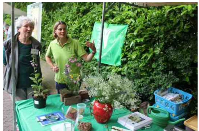
De KNNV-stand op de Zompmarkt in 2016

De heemtuin ligt in een prachtig wandel- en fietsgebied in Oosterbeek en is per fiets of te voet goed bereikbaar. Op