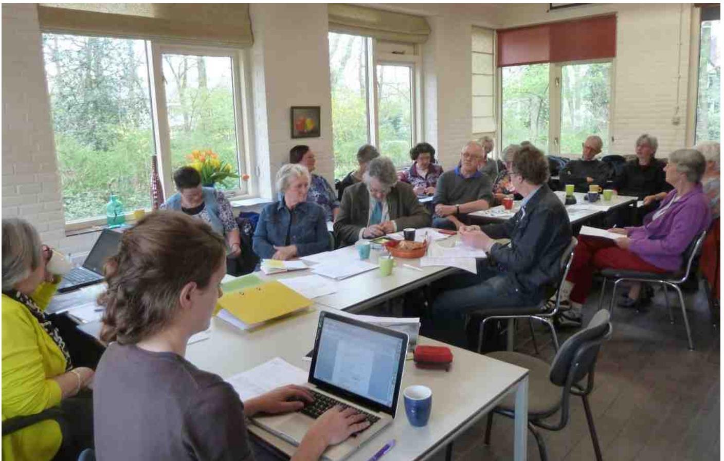
Foto onder: Algemene ledenvergadering op 5 april jl. in het Koetshuis, Arboretum Belmonte, Wageningen