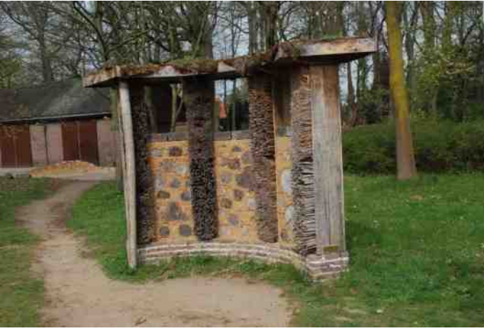
5 april, gras groeit rond BZZ-halte