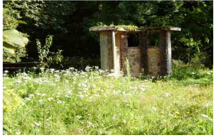
3 september, grondbewerking en herinzaai leverde een bloemenzee