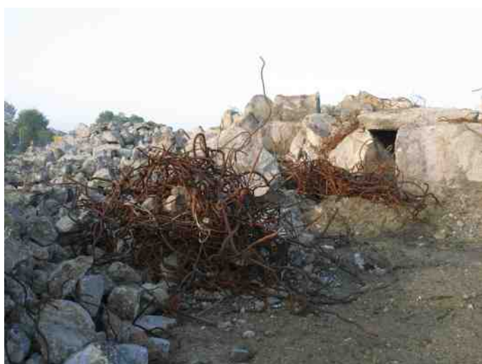
Linksboven: 13 augustus 2010: Resten beton en ijzer