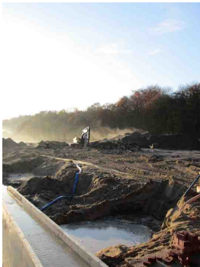
Onder: 5 september 2013: Vernieuwd Renkums beekdal