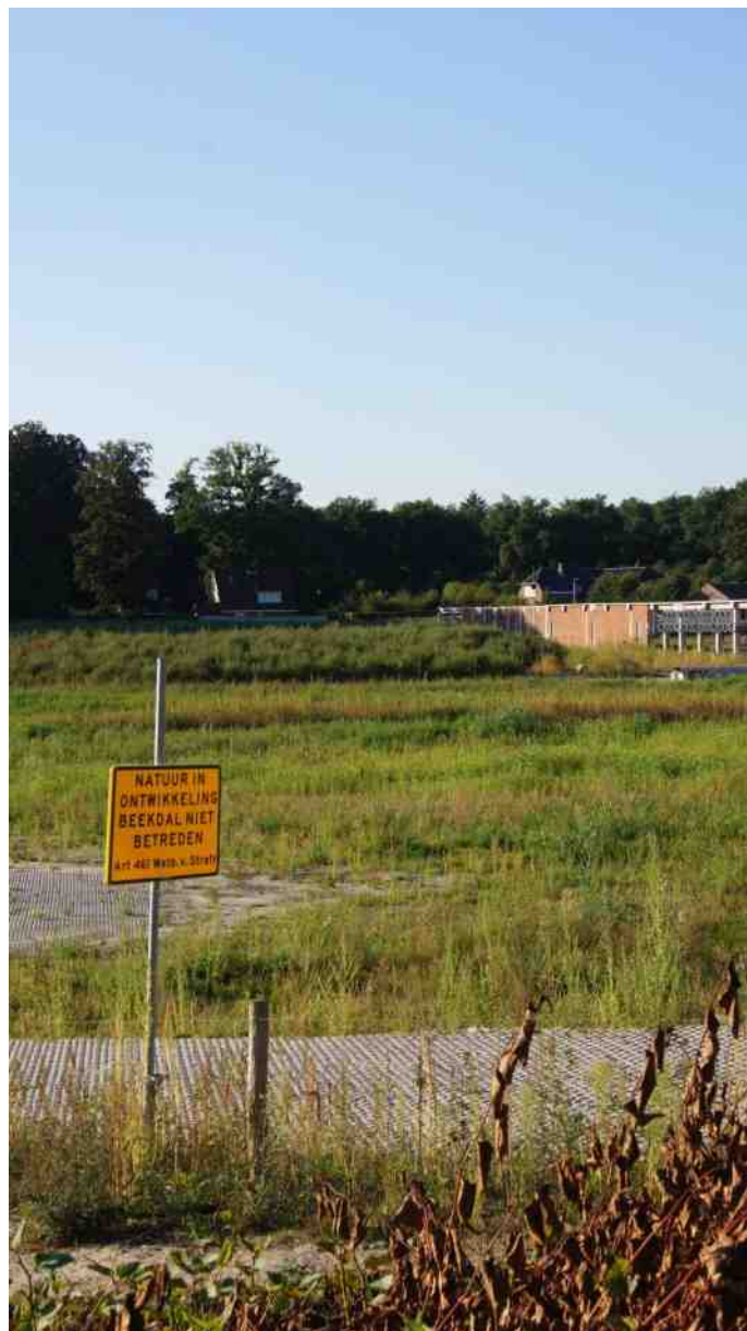
Renkums beekdal, natuurgebied in ontwikkeling