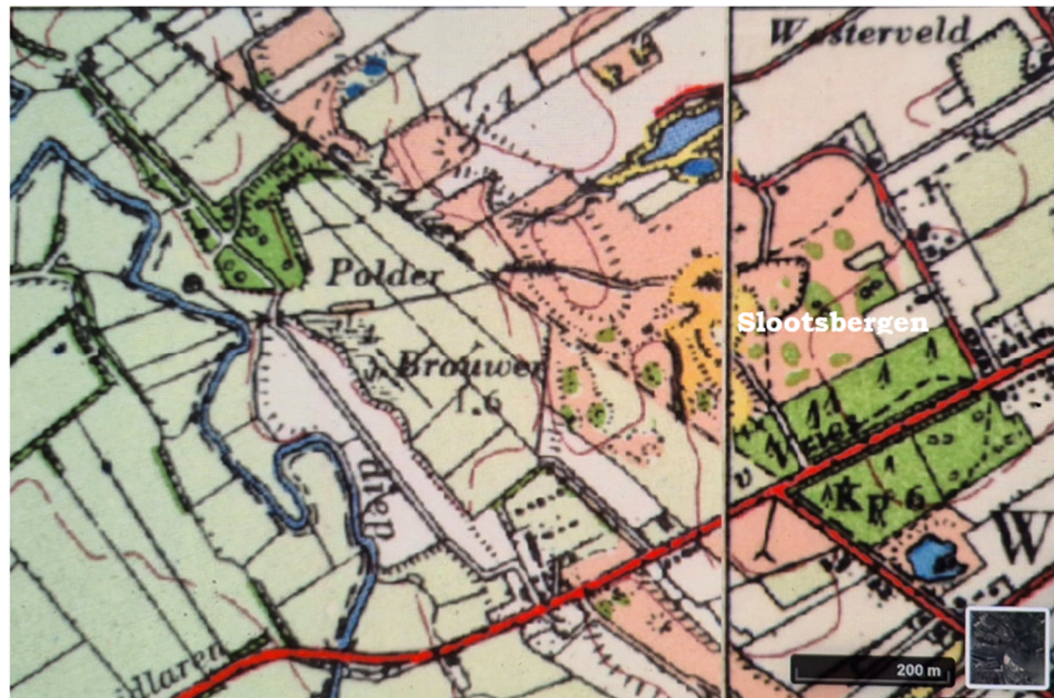
Figuur 2 Overzichtskaart Westerveld rond 1956

In de jaren '50 was het gebied landschappelijk nog in grote lijnen gelijk aan de situatie van voor de 2 e wereldoorlog (figuur 2). De venige laagte met blokvormige verveningen was omgevormd tot een lage polder genaamd polder Brouwer. Bij het afvoerpunt naar het Westerdiep heeft een molentje gestaan. Verder zien we op deze kaart dat in de noordoosthoek van het gebied de eerste diepe zandontgravingen hebben plaatsgevonden, waardoor een kleine plas was ontstaan. Verder tekent zich het kale, relatief hoge duingebied van Slootsbergen nabij de Verlengde Stationsweg zich af.