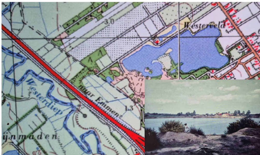
Figuur 3 Overzichtskaart Westerveld 1975.

In de jaren '50 was het gebied landschappelijk nog in grote lijnen gelijk aan de situatie van voor de 2 e wereldoorlog (figuur 2). De venige laagte met blokvormige verveningen was omgevormd tot een lage polder genaamd polder Brouwer. Bij het afvoerpunt naar het Westerdiep heeft een molentje gestaan. Verder zien we op deze kaart dat in de noordoosthoek van het gebied de eerste diepe zandontgravingen hebben plaatsgevonden, waardoor een kleine plas was ontstaan. Verder tekent zich het kale, relatief hoge duingebied van Slootsbergen nabij de Verlengde Stationsweg zich af.