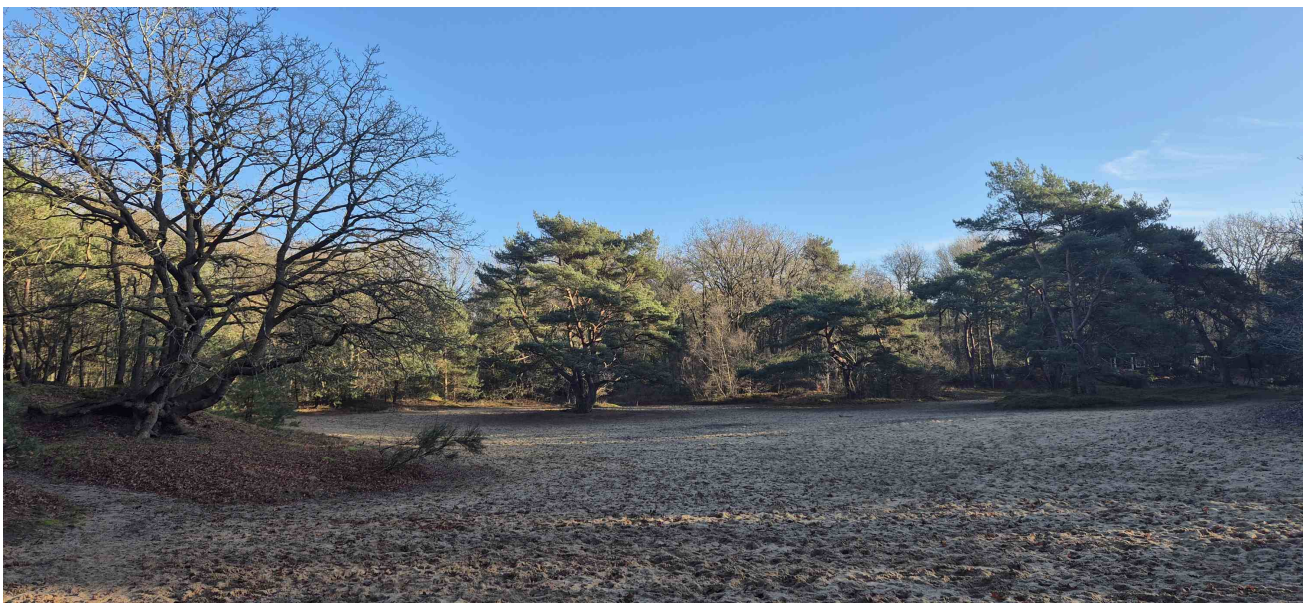
Centrale zandvlakte duingebied Slootsbergen

Middenin het bos ligt een fraaie stuifzandvlakte, waar in de zomer veel gerecreëerd wordt.