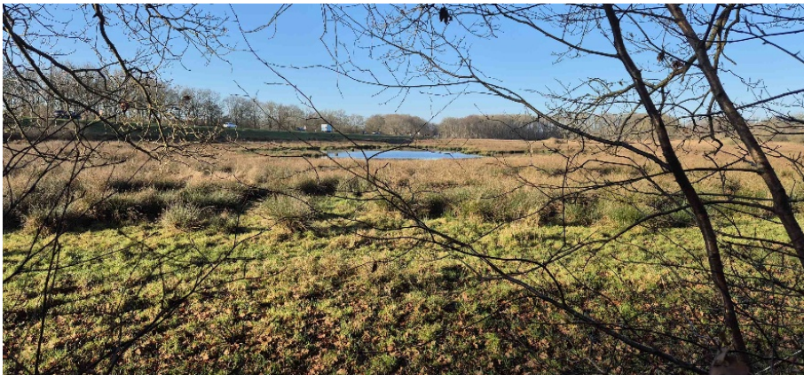
Uitzicht op de ingesloten beekdallaagte bij N34

Dit punt langs de rand van het bos geeft een mooi uitzicht op het brede beekdal (vroegere polder Brouwer) van het Westerdiep. Bij veel regen of hoge beekwaterstanden stroomt het gebied onder water. In het voorjaar komen bij zakkende waterstanden slibrijke oevers en platen tevoorschijn waar meerdere soorten steltlopers en eenden hun voedsel zoeken. Moeilijk is voor te stellen dat voor de aanleg van de N34 dit gebied een landbouwpolder was.