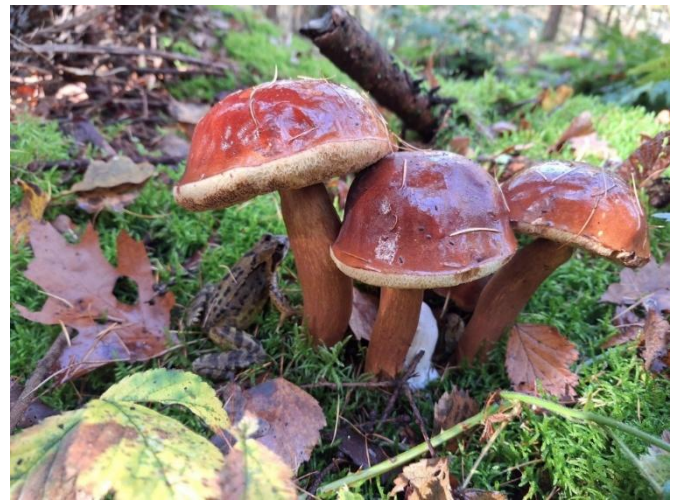
Kastanjeboleten tijdens paddenstoelenwandeling