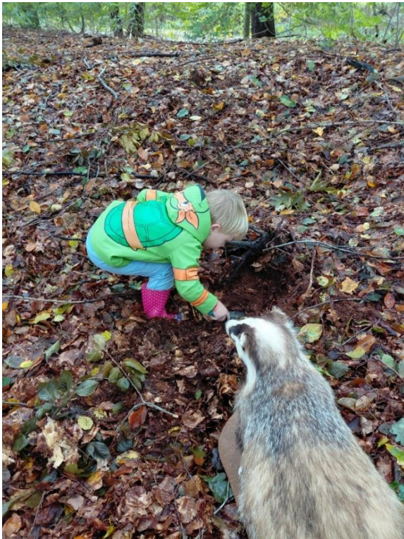
Kennismaking met de das op de ontdekkingstocht