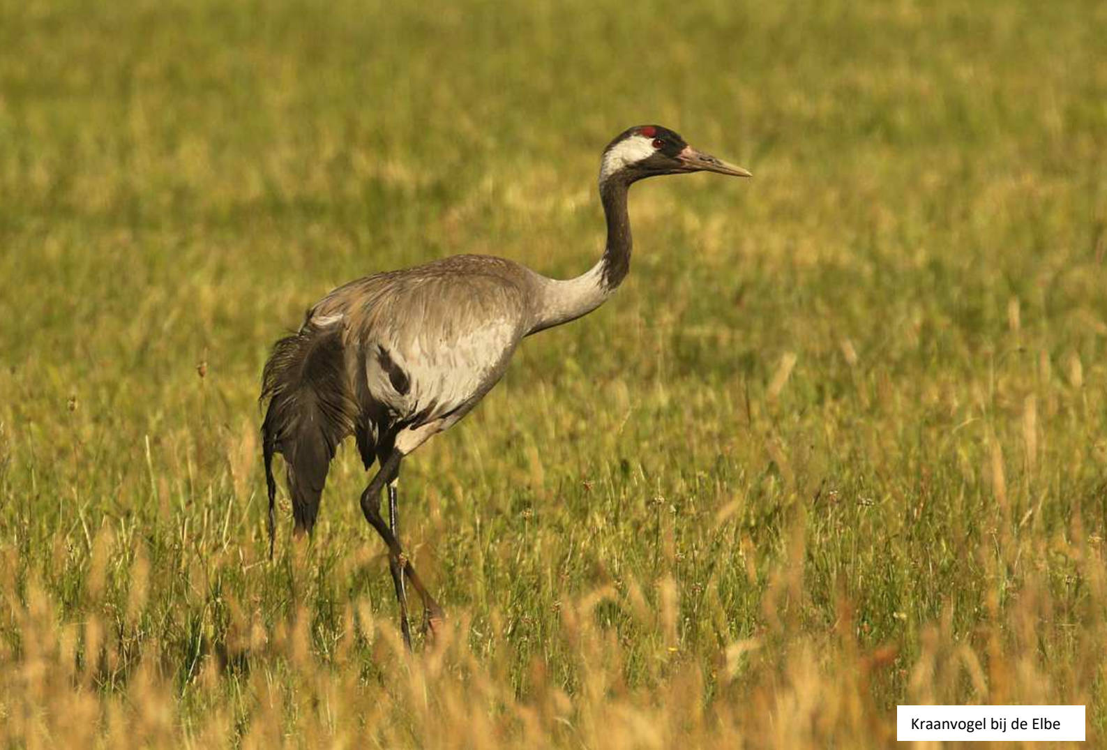
Kraanvogel bij de Elbe