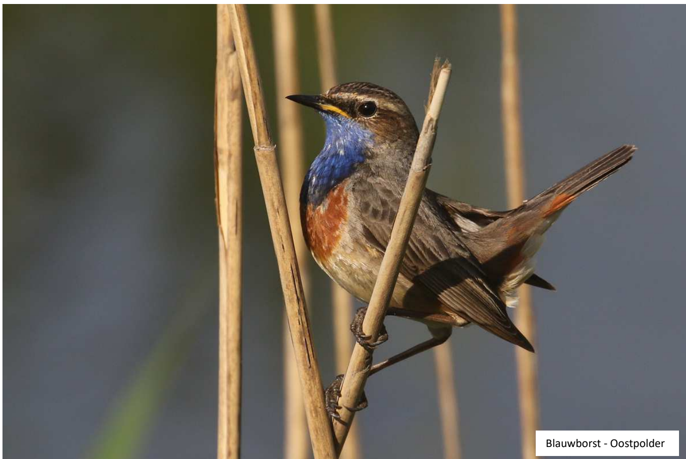
Blauwborst - Oostpolder

Juvenile visdief P46 in de haven van Lauwersoog had ik al in de appgroep laten zien. Toch hier ook maar even (om beter te kunnen bekijken 😊)