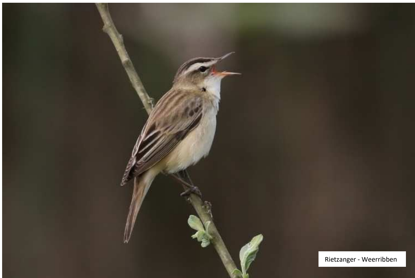
Rietzanger - Weerribben

Bij ons uitje naar de Weerribben was er zo'n mooi fotomoment en een paar dagen later ook in de Oostpolder. Kijk maar naar de foto's hieronder!