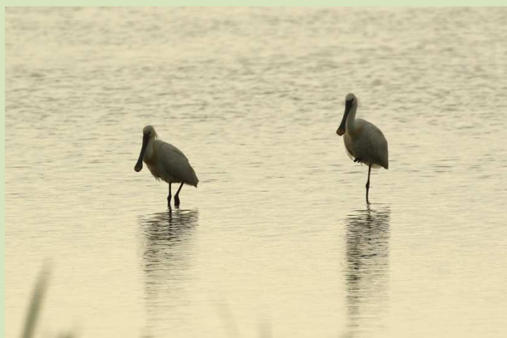
Nog een paar vogels in Tusschenwater