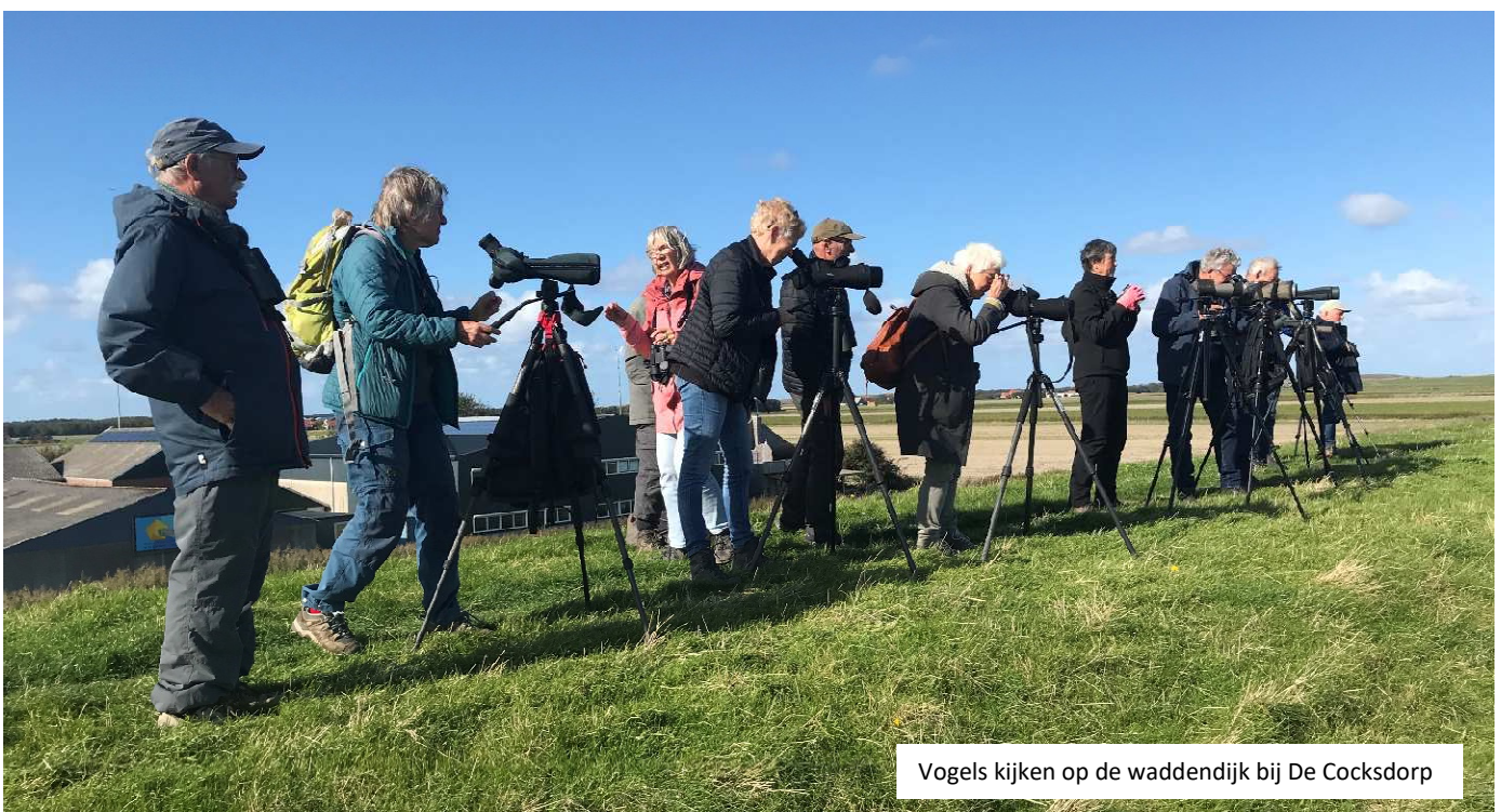
Vogels kijken op de waddendijk bij De Cocksdorp