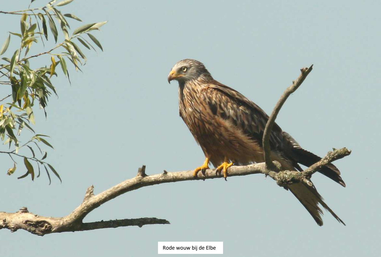
Rode wouw bij de Elbe