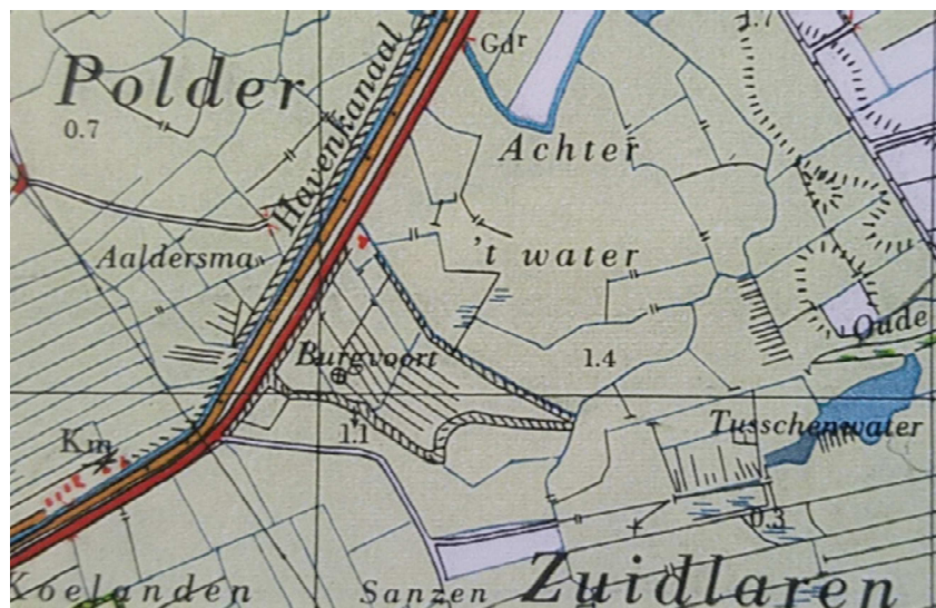
Figuur 4: Poldertje Burgvoort in de jaren '60

De lage ligging van het gebied ofwel de vroegere aanwezigheid van een dik veenpakket is een aanwijzing dat hier vroeger (een tak van) de oude Hunze heeft gelegen. Ook het woord 'Burgvoort', verwijzend naar een doorwaadbare plaats in een beek ('voorde') in de omgeving van een burcht, vormt een aanwijzing dat de Hunze hier waarschijnlijk gelopen heeft. In de huidige situatie vormt het gebied één van de diepste delen van Tusschenwater, waarbij altijd, ook in de zomer, water blijft staan. Op deze plaats onder de kade is een stuw met duiker aangelegd. Het betreft het uitlaatwerk van het westelijke deel van Tusschenwater (deelgebieden Oude Diep en Burgvoort). Het water kan in de huidige situatie via de randsloot afgevoerd worden naar Leiding 2. De laatste tijd staat het uitlaatwerk dicht, zodat geen overtollig water wordt afgevoerd en er zich in Tusschenwater een natuurlijke waterstand kan instellen afhankelijk van neerslag, verdamping en wegzijging naar de ondergrond. De dynamiek van het systeem komt heel duidelijk naar voren als we de hoge zomerwaterstanden van dit jaar (het natte jaar 2021) vergelijken met de lage zomerwaterstanden van vorig jaar (het droge jaar 2020). We volgen de kade richting Zuidlaren en via enkele bochten in de kade komen we weer op ons startpunt aan bij de weg de Osbroeken.