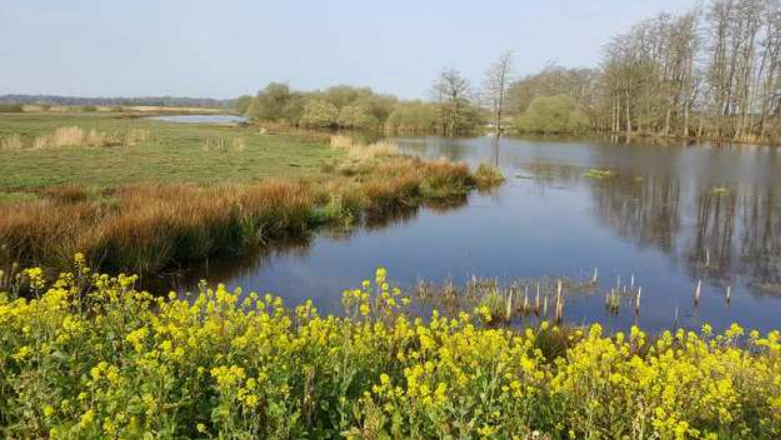
Zicht op het Oude Diep in westelijke richting vanaf het fietsbruggetje (foto voorjaar 2020)

Maar verder weg in zuidoostelijke richting heeft zich in het Groeeveld een grote waterplas gevormd met in het midden een prachtig ‘meeuwen’ eiland. Tussen de vele kokmeeuwen die hier broeden worden regelmatig zwartkopmeeuwen waargenomen. En dan niet te vergeten de vele Lepelaars die in het ondiepe water een prachtig foerageergebied hebben gevonden.