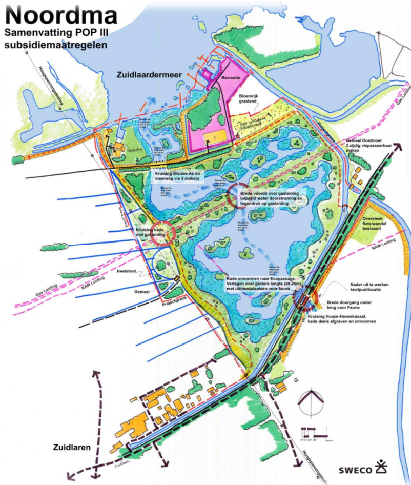
Figuur 3: Schetsplan toekomstige inrichting Noordma

In het najaar/winternummer 2019 van NZ is een toelichting gegeven op dit Noordmaplan. In dit plan komt de monding van de Hunze tussen het recreatieterrein van Meerzicht en de surfweide in te liggen. Het recreatieterrein van Meerzicht komt als een soort schiereiland in dit nieuwe wetland te liggen. Een brug in de Meerweg zorgt voor een verbinding met Midlaren. Bij een wilgenbosje (9) op de hoek waar de weg Noordma een bocht naar rechts maakt gaan we linksaf het smalle fietspadje op, terug naar het hoogholtje over het Havenkanaal. Het fietspad volgt een oud kronkelig slootje, waarvan de loop terug te voeren is naar een historische situatie van de Hunze-delta, waarbij de Hunze meerdere zijarmen had (figuur 1). We nemen weer het hoogholtje over het Havenkanaal, lopen een klein stukje over het fietspad richting de Groeve, steken vóór het gemaal Oostermoer de Hunzeweg over (goed uitkijken voor het verkeer!) en volgen het rechter schouwpad van Leiding 2.