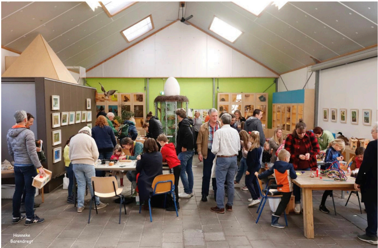
Drukte tijdens de 'doe eens lekker duurzaam markt' met op de bruine wand links en de witte wand rechts de nieuwe foto's.

De expogroep, Wendela van Lynden en Marleen Wessels