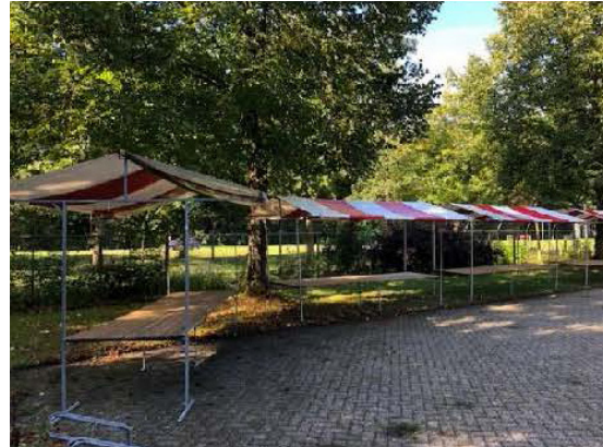
het opbouwen van de markt