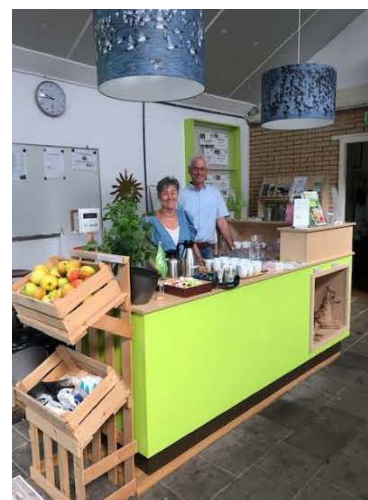
het balieteam staat klaar