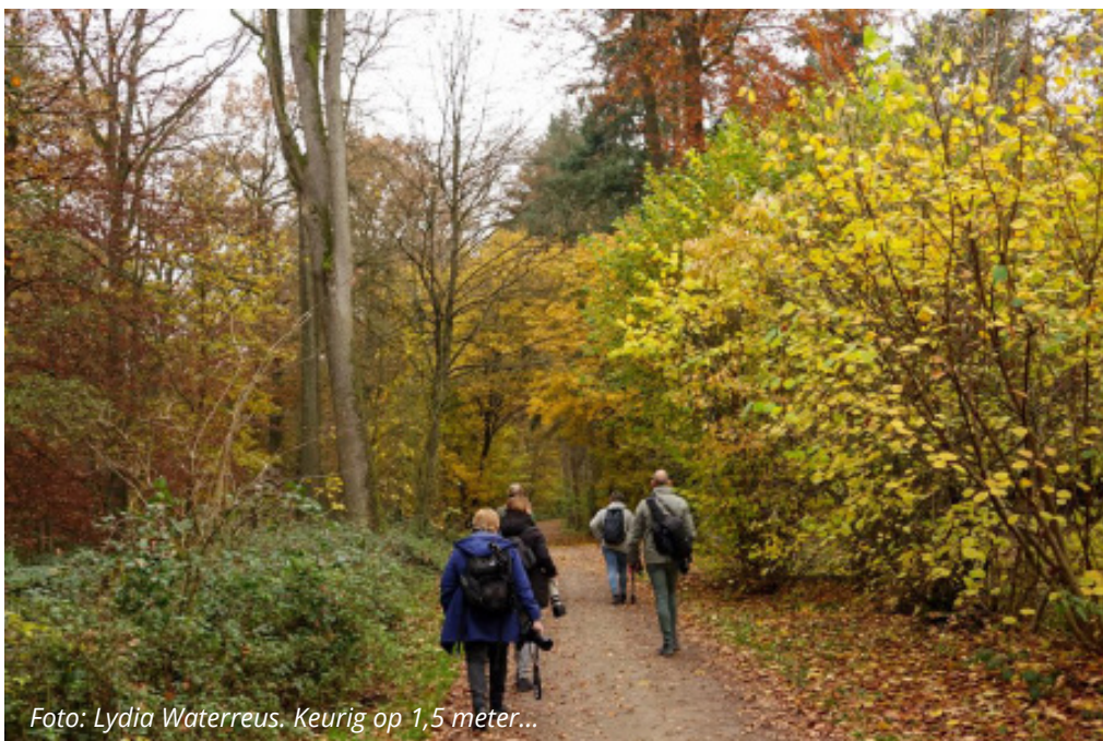
Keurig op 1,5 meter...