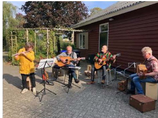
gezellig rond de vuurkuil met muziek