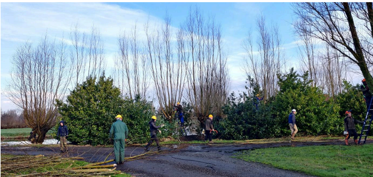
Zaterdag 24 februari 2024 bij Familie Fokkens aan de van Teylingenweg in Oud-Kamerik