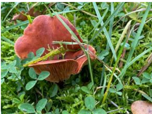
Tekst en foto's Brigitte Bloem, Fluitenkruid januari 2024

Hij ruikt vrij sterk en ietwat rubberachtig, het witte melksap is witgeel opdrogend op een papieren zakdoek en de smaak is iets bitter (naast uiterlijke kenmerken zijn geur, smaak en kleur melksap onderscheidende kenmerken van melkzwammen). Er zijn 90 atlasblokken geregistreerd sinds 1990 en de soort staat als kwetsbaar op de Rode lijst van 2008.