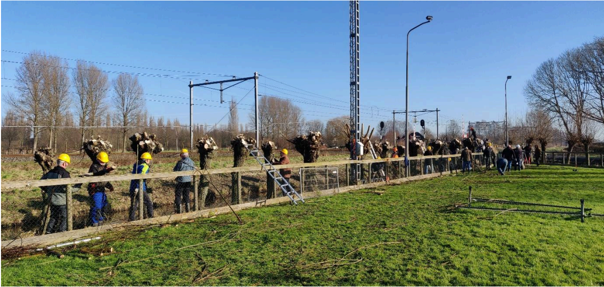
Zaterdag 27 januari 2024 bij de Kynologenclub aan de Waardsedijk in Woerden