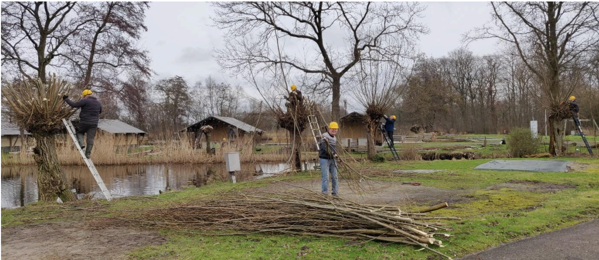
Zaterdag 10 februari 2024 op Camping Batenstein in Woerden