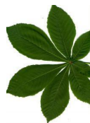
Samengesteld Handvormig (deelblaadjes vanuit een punt aangehecht)