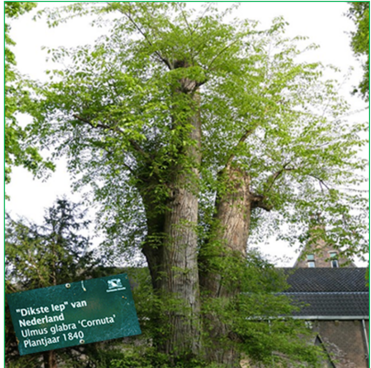
Monumentale duiveltjesiep in Utrecht.

In alle andere kenmerken verschilt de duiveltjesiep niet van de wilde vorm van de bergiep. Hij kan 35 tot 40 m hoog worden, de kroon is breed uitgespreid, de bladeren zijn groot, breed elliptisch, aan de bovenzijde ruw, ook de vruchten zijn relatief groot en bijna cirkelvormig. De in Nederland autochtone bergiep behoort tot het geslacht Ulmus . Vóór de bladontwikkeling verschijnen in februari-maart de bruin violette bloemen. De vruchten, gevleugelde nootjes, worden door de wind verspreid.