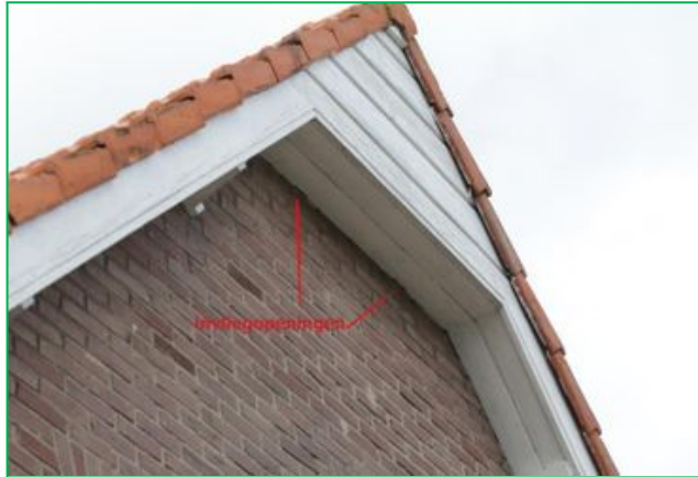
Foto 1: In de onderkant van de dakgoot bak zijn kleine openingen gemaakt die vleermuizen kunnen gebruiken als onderkomen.

Foto 2: Van de onderlat is een klein stukje opgehouden zodat vleermuizen daarin kunnen kruipen. Die hebben dan achter de planken een mooie ruimte om te verblijven. Om meer vleermuizen ruimte te geven gebeurt dit op meerdere plekken.