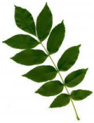
Samengesteld geveerd (deelblaadjes als langs veer ingeplant)

Heel leuk vonden we het verzoek van IVN Utrecht om een workshop determineren te verzorgen bij de ontmoetingsdag voor IVN vrijwilligers. Probleem was wel dat deze dag op 30 september gepland was bij het Beauforthuis in Austerlitz en wij vroegen ons af wat er eind september in deze bosrijke omgeving nog aan wilde planten te determineren viel. Gelukkig had Theo een goede oplossing: bomen determineren. Je kunt bomen determineren aan de hand van de eigenschappen van de bladeren. Daarvoor is wel een goede determinatietabel nodig, maar ook die werd door Theo aangeleverd.