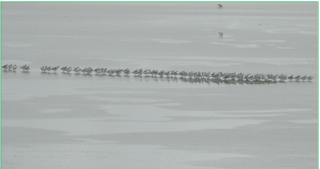
Eem mooi rijtje rustende drieteenstrandlopers