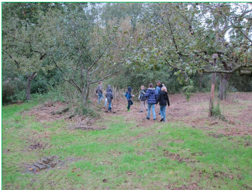
Opzoek naar spinnen

De herfst is spinnentijd. We kennen het allemaal wel. Ga je s'morgens vroeg de deur uit, dan loop je soms met je gezicht in een onzichtbaar spinnenweb. Met de groep hebben we het in oktober over spinnen gehad. Met speelse opdrachten eerst in het veld gekeken naar verschillende spinnen en kenmerken. Later in de ochtend hebben de Buitenbanjers hun eigen spin mogen maken. Dat werden kleurrijke exemplaren.