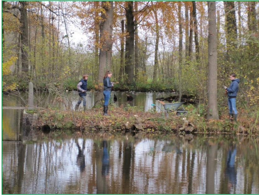
Zicht op de centrale vijver stiltegebied.

We hebben deze maand aan de hand van het beheerplan Landgoed Bredius werk verricht in het stiltegebied. Langs de oeverranden hebben we houtachtige van els, iep, wilg en es verwijderd om weer zicht te krijgen op de centrale binnenvijver en de Eikenlaan van het stiltegebied.