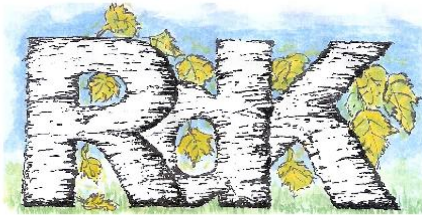
RDK Boomverzorging en Tuinonderhoud