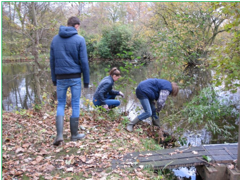
Het snoeien van wilgen bij de kantelplank