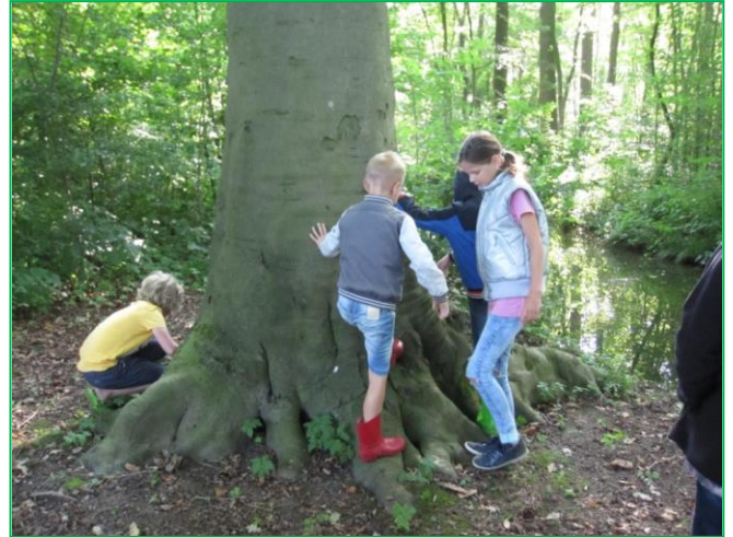
Het zoeken naar beukenootjes