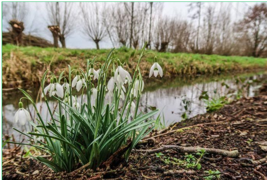
Deze stoere sneeuwkllokjes bloeien nu in het Brediuspark

'Geen mens groot of klein, die niet weet dat er sneeuwkllokjes in de wereld zijn'. Met deze zin begon Eli Hermans zijn eerste artikel voor het tijdschrift De Levende Natuur, dat hij in 1896 samen met Jac.P.Thijssse had opgericht. De twee Amsterdamse schoolmeesters deelden hun liefde voor de natuur en hebben sindsdien nog heel vaak geschreven over de sneeuwkllokjes als symbool voor de hoop, voor het nieuwe ontwaken en vooral de lenteverwachting.