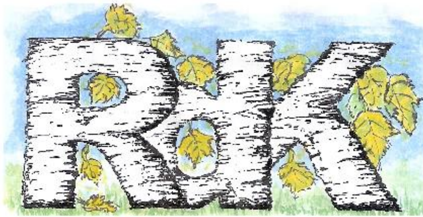
RDK Boomverzorging en Tuinonderhoud