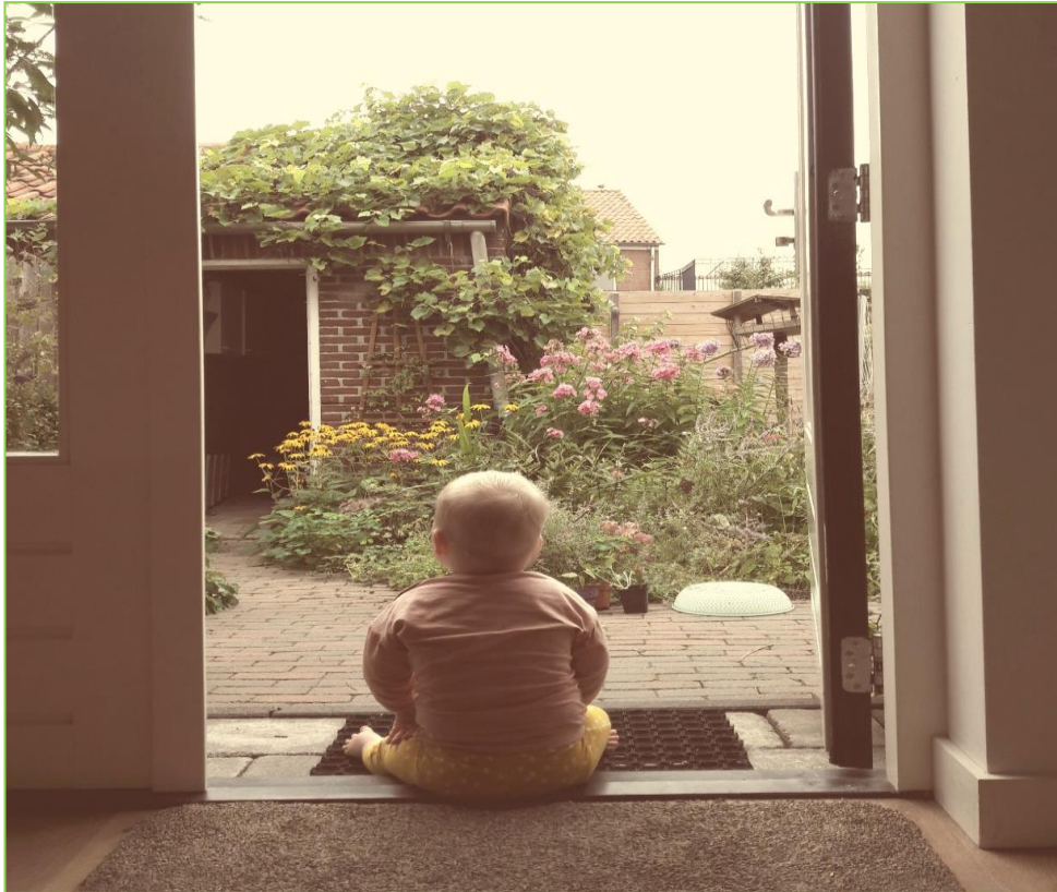
Afbeelding; Natuur vanuit de deurpost. Inmiddels is geen drempel te hoog.