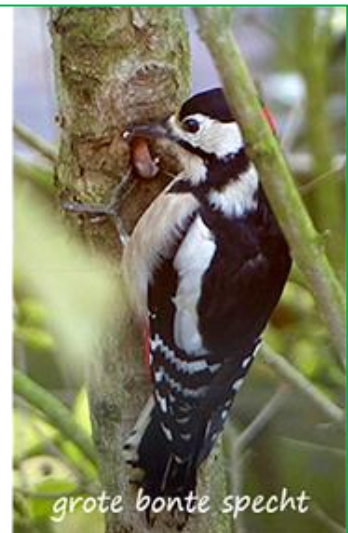
grote bonte specht