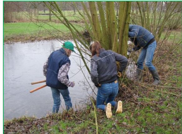
Na gedane arbeid is het goed rusten