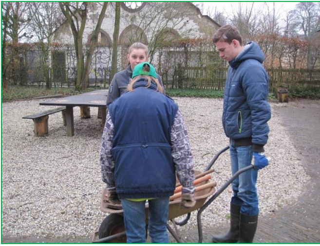
Het juiste gereedschap gaat in de kruitwagen