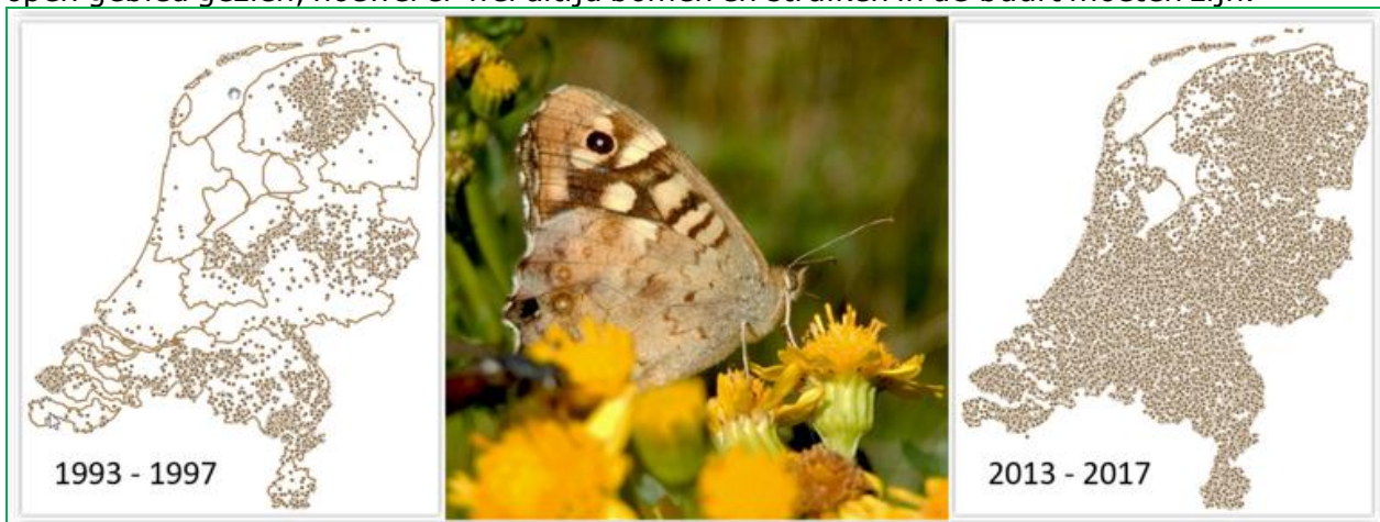
Verspreiding bont zandoogje 1993-1997 en 2013-2017

Dat ze zo wijd verbreid zijn, is nog niet zo lang het geval. Als we de kaartjes van de periode 1993 tot en met 1997 vergelijken met die van 2013 tot en met 2017, zien we een hele sterke toename. Nu zijn er tegenwoordig met de digitale invoerportalen veel meer waarnemingen dan in die eerste periode. De verspreiding was echter ook in de negentiger jaren goed bekend; het kaartje hieronder geeft daar een reëel beeld van. Vroeger was het bont zandoogje een echte bosvlinder: hij bezette daar zonnige plekjes op bospaden en open plekken in het bos. De laatste jaren wordt hij ook veel in open gebied gezien, hoewel er wel altijd bomen en struiken in de buurt moeten zijn.