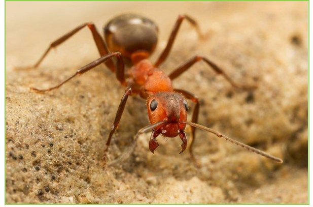
De stronkmier, een bedreigde soort