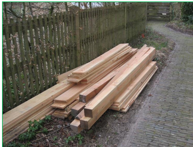
Het bestelde hout voor het vogelscherm

In maart zouden we starten met het maken van een vogelscherm in het Buitenbanjerterrein. Voor dit project was subsidie van 'Groen doet Goed' aanwezig. In november 2017 is het plan besproken in de werkgroep beheer van de stichting landgoed Bredius. Iedereen vond het een leuk idee. De subsidie werd aangevraagd en goedgekeurd. Er werd gemeten, de tekening gemaakt en het hout besteld. Een week voor we zouden starten, werd het project afgeblazen door de stichting landgoed Bredius. Het bestuur vond het toch niet passen op het landgoed. Een zware teleurstelling voor de groep en zeker voor mij, want we waren maanden druk geweest met de voorbereiding. Als alternatief hebben op deze 17 maart, die zeer koud was door de Oostenwind, op het terrein enkele opruimwerkzaamheden gedaan. We hadden voor deze dag toch een heel ander voornemen.