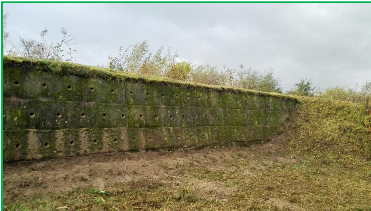
Vogelkijkwand Natuurplas Breeveld.

Kom jij ook helpen bij deze leuke klus? We verzamelen om 10.00 uur op de houten brug op Veldwijk. Meld je aan via NL Doet of bij ondergetekende.