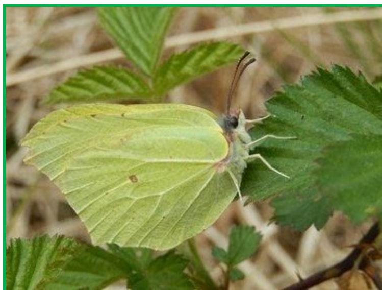
De citroenvlinder ging in de jaren 10 sterk vooruit