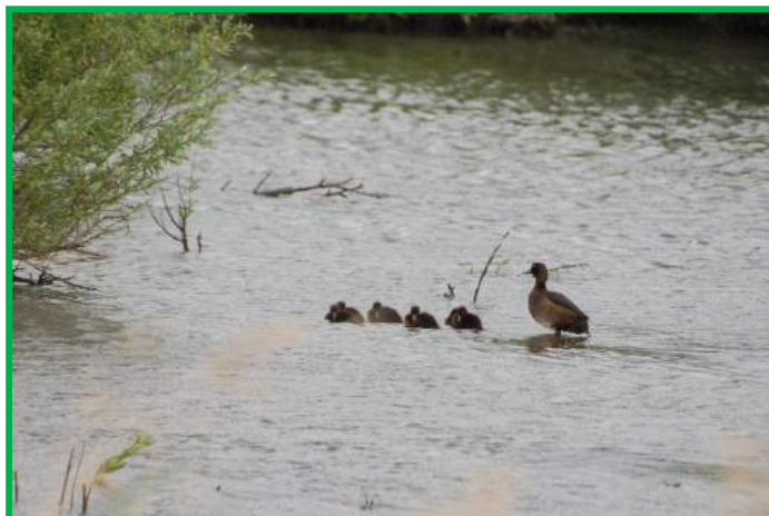
Mevrouw kuifeend met 5 jongen

Op zaterdag 8 juni zijn we naar de Zevenhuizerplas geweest. Met zijn negenen trotseerden we harde wind en een fikse regenbui.