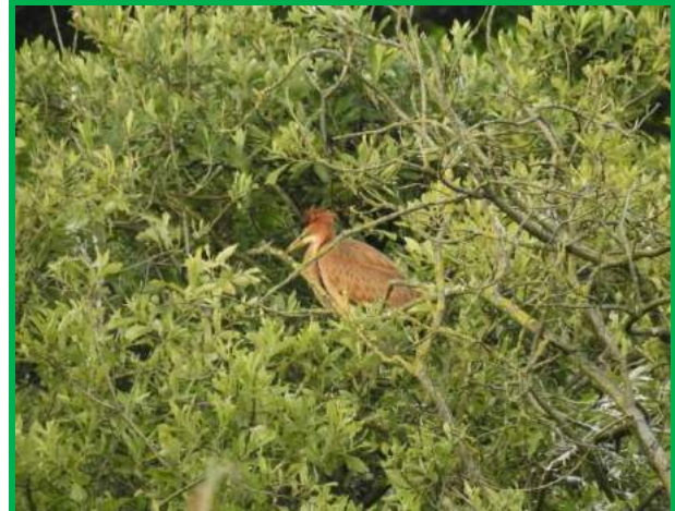
Jonge purperreiger op het nest

"Het is nog erg stil met het aanvliegen van de volwassen purperreiger" riep de schipper, waarop ik grapte: "Het is nog geen acht uur". Even over achten kwam de ene na de andere purperreiger de kolonie in vliegen. Soms ongelukkig landen tussen de struiken, maar de meeste zochten een hoge boomtop uit waar we ze goed konden zien. Een prachtig schouwspel waar iedereen in de boot van genoot.