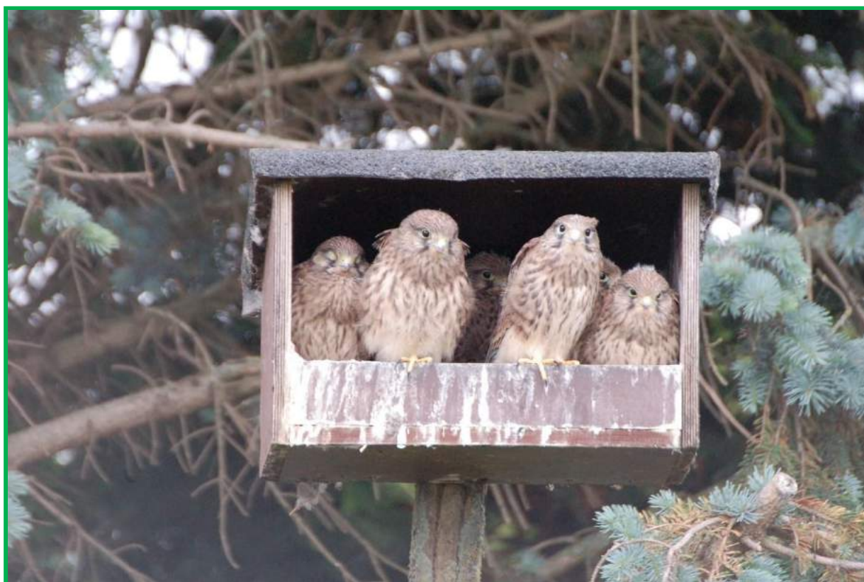
Jonge torenvalken, 6 stuks! Nabij Zevenhuizerplas op 08-06-2019