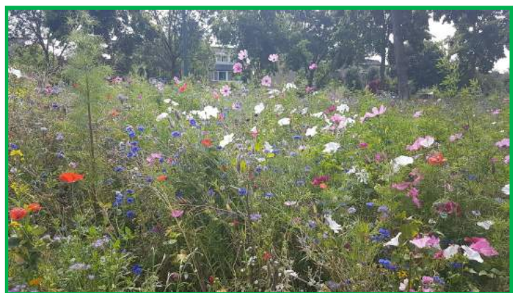
Tekst en foto's: Vivian van Deel