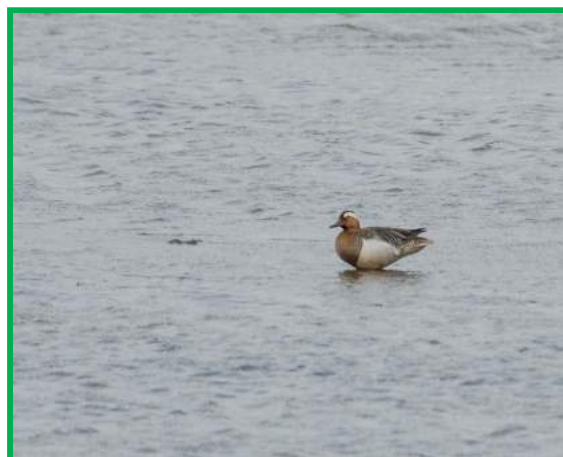
Zomertaling op de Zevenhuizerplas