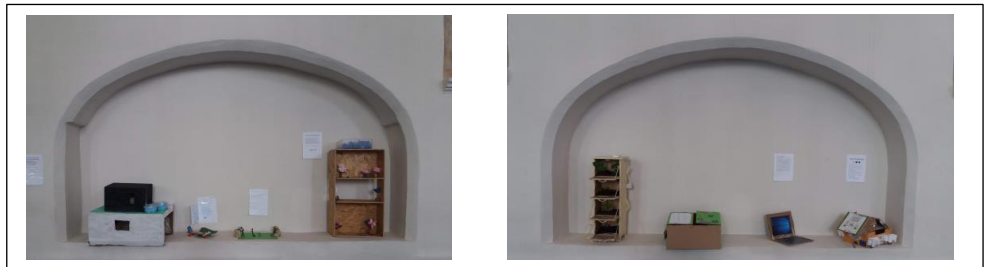
Voorbeelden van inzendingen voor de Markt van de Toekomst

Een aantal groepen kreeg ondersteuning bij de uitvoering van hun ideeën over o.a. plastic soup, verticaal groen en elektrisch rijden. De 10 groepen stelden hun producten ten toon in de grote kerk en de wethouder had leuke prijzen voor de mooiste, meest originele en beste inzending. Deze dag, 26 mei, was een groot succes.