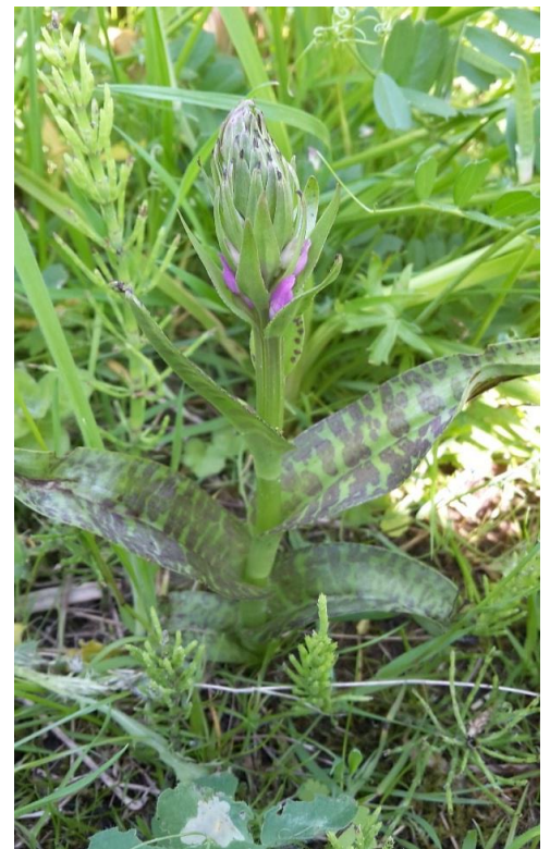
Figuur 1 gevlekte of brede orchis

Opvallend is dat Kleverige ogentroost niet is aangetroffen. Aan de oever hebben zich ondertussen veel Orchideeën van het Rietorchis-complex gevestigd. Een verheugende ontwikkeling. Dé topper van het jaar is ook in dit opnamevlak gevonden: meerdere individuen van de Moeras Wespenorchis!! (Ik heb 6 individuen geteld). Kamgras en Kluwenklokje zijn ook aangetroffen. Als gevolg van de uitzonderlijke omstandigheden gedurende de zomer had de vegetatie ook hier veel te lijden. De oever, die minder te lijden heeft van de droogte en de hoge temperatuur, groeide uitbundig.