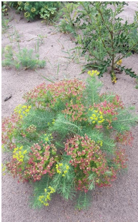
Figuur 9 cipreswolfsmelk, euphorbia cyparissias , fries: Sipresduveldrek

De terugkeer van natuurlijke processen zoals erosie, sedimentatie en natuurlijke begrazing schudt de natuur wakker. De uiterwaarden, voorheen bestaand uit boerenweilanden en akkers, zijn omgetoverd tot bloemrijke graslanden, moerassen, ruigtes, struwelen en bossen waar grote kuddes runderen en paarden doorheen trekken. Het natuurherstel gaat hier razendsnel, dat blijkt telkens weer als dieren en planten spontaan terugkeren. Natuurontwikkeling gaat er hand in hand met economische en maatschappelijke ontwikkelingen, zoals grondwinning en hoogwaterbescherming.