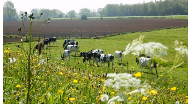
Figuur 8 winterdijk Lekdijk west

Hans heeft op de Langbroekerdijk west in een vroege en een late telling maar liefst 96 soorten planten gezien, waarvan 20 met een hogere natuurwaarde. Er staat op een plek nog aardaker en hij vond krabbescheer in de sloot. Dit is niet overal zo langs deze dijk. Het rijkste deel valt onmiddellijk op, hoewel hier ook met de maaizuigcombinatie gemaaid is, maar de gespaarde stukken bevinden zich om de bomen en op het schuine talud naar de wetering. Langs het asfalt is uiteraard een dichtgereden kale strook. Wij zoeken de verklaring voor deze rijke berm in de grondsoorten (zanderig) en de diverse gradiënten, slootkant met schone wetering.