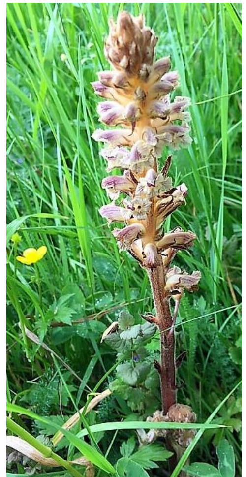
Figuur 5 klavervreter