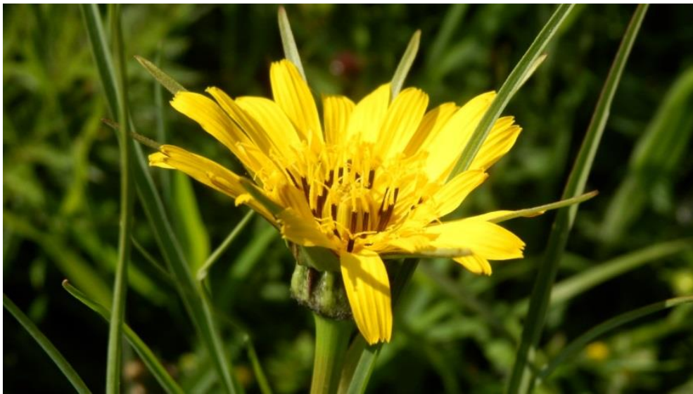
Figuur 6 gele morgenster

Natte hooilanden: kievitsbloem-, weidekervel- of grote pimpernelhooiland worden tot vochtig hooiland gerekend.