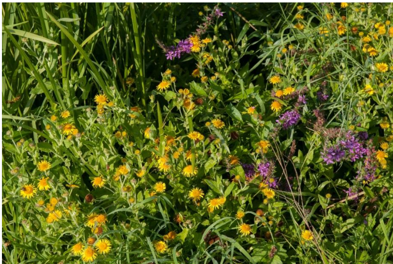
Figuur 3 heelblaadje en kattenstaart