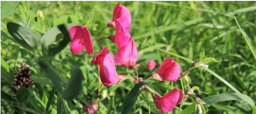
Figuur 4 Boven aardaker . Onder de afzetting

De Romeinenbaan is twee maal door alle floraleden geïntervieweerd. Het deel vanaf rotonde bij fruithuisje tot busstation is zeer bloemrijk: ringelwikke, veldlathyrus, pastinaak, sint janskruid, rolklavers, het zoemt er van de bijen. Er staan maar liefst 17 soorten met een hoge natuurwaarde, waarvan vijf soorten met een zeer hoge waarde: aardaker, agrimonie, kleine ratelaar, klavervreter en kantig hertshooi. Enige verstoring kwam door de maaizuigcombinatie van Florijn. Er waren al meerdere voorstellen gedaan om hier een ander maaregiem te hanteren. Na het vinden van de klavervreter (orobanche minor), een beschermde soort, hadden we goede reden om via de gemeente te vragen deze soort te beschermen. Het werd afgezet met paaltjes en kleurrijke stroken. Uiteindelijk zijn er meerdere stroken in de tweede maaibeurt niet gemaaid en staan dus de winter over.