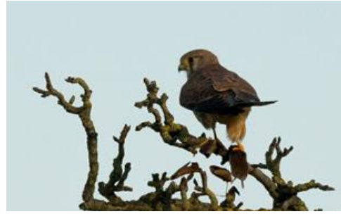
Torenvalk met prooi

De Broedvogelmonitoring vindt plaats vanaf eind maart tot en met half juni. In deze periode worden om de veertien dagen de vogels geteld die aanwezig zijn in de Lunenburgerwaard en de Waarden van Gravenbol. De tellingen vinden vanaf zonsopkomst plaats en de gegevens worden via een app doorgegeven aan Sovon. Een computerprogramma berekent met behulp van criteria of er en hoeveel broedterritoria per soort aanwezig zijn.