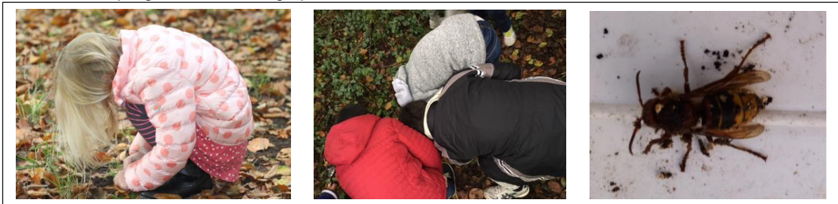
Onder de grond valt heel wat te ontdekken!

Parallel hieraan kunnen leerlingen ook aan de slag met grote wilgentenen op het speelpark De Horden. Het programma is aardig op stoom.