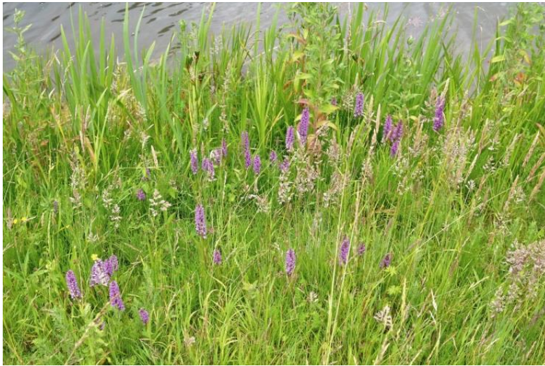
Figuur 2 riet- of gevlekte orchissen en witbol

Aan de oeverzone kan worden doorgegaan met het beheer zoals het nu is. De oeverzone moet met voorzichtigheid worden behandeld d.w.z. slechts één keer maaien in de late zomer.