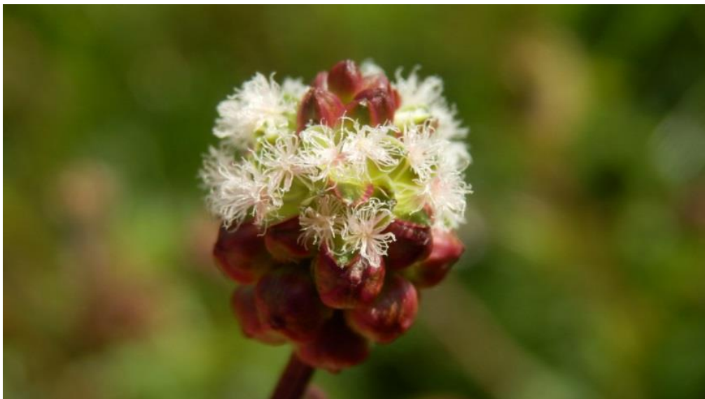
Figuur 7 grote pimpinella