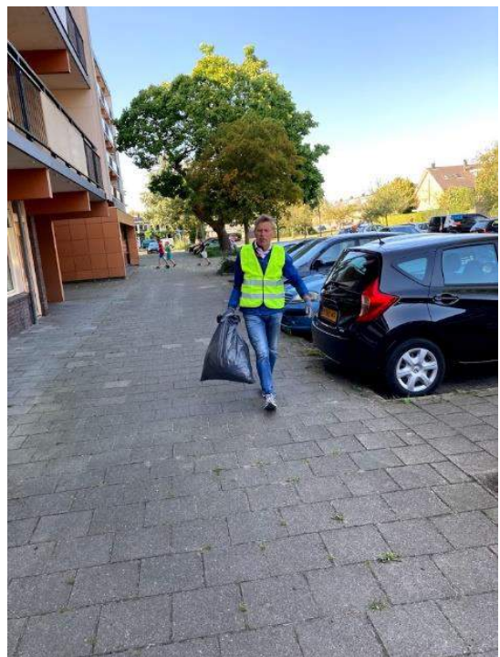
Figuur 3 aan de slag binnen de bebouwde kom

En zoals meestal het geval is met dit soort activiteiten, hebben we weer enkele nieuwe vaste deelnemers mogen verwelkomen.