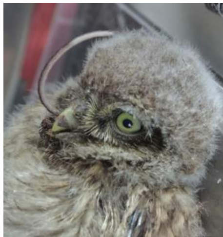
Jonge Steenuil met de staart van een muis nog uit zijn bek.

Van de vogelexcursies is alleen die in januari naar de Everdinger Waarden doorgedaan. Het jaarprogramma dat voor 2020 was gemaakt, ligt klaar om weer te worden opgepakt, zo gauw de situatie dat toe laat.