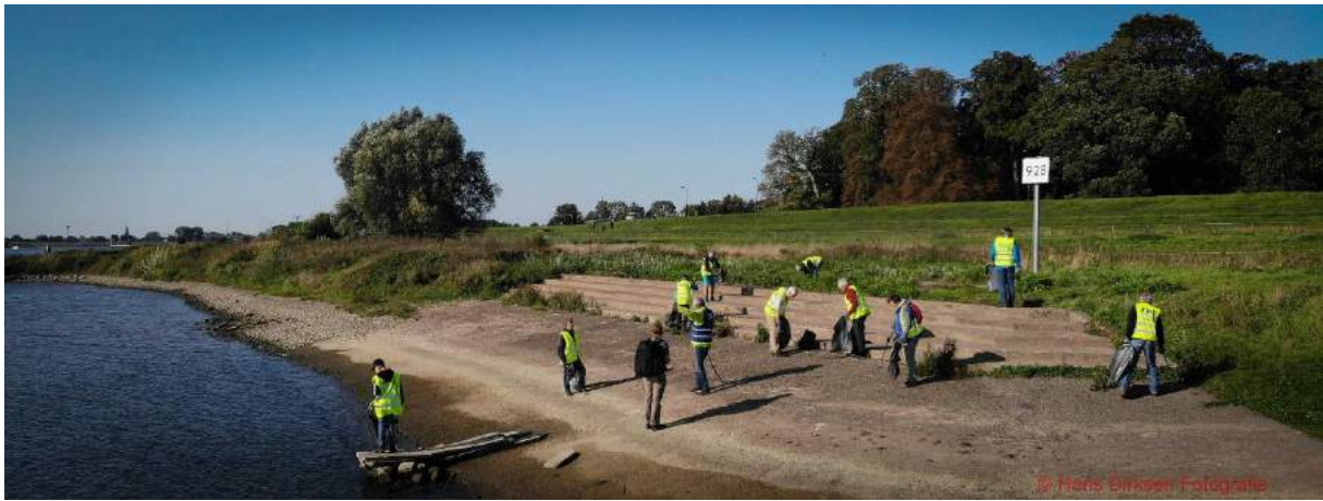
Figuur 2 Opruimen aan de oevers van de Lek

Na de koffie en introductie gingen de deelnemers in verschillende groepen uiteen. Zo'n 16 deelnemers gingen naar de Lek om eerst van Ruud Waltman uitleg te krijgen over de natuurlijke waarden van het rivierenlandschap. Daarna was het opruimen geblazen aan de oevers van de Lek. Hans Dirksen heeft van deze activiteiten prachtige plaatjes geschoten met zijn drone.