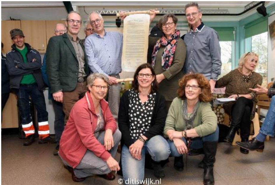
een foto van ditiswijk.