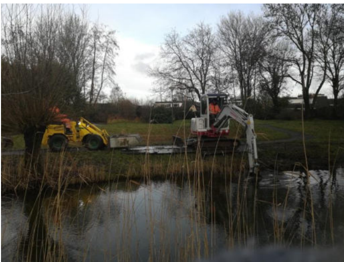
het uitdiepen en opschonen van de oever van de meander