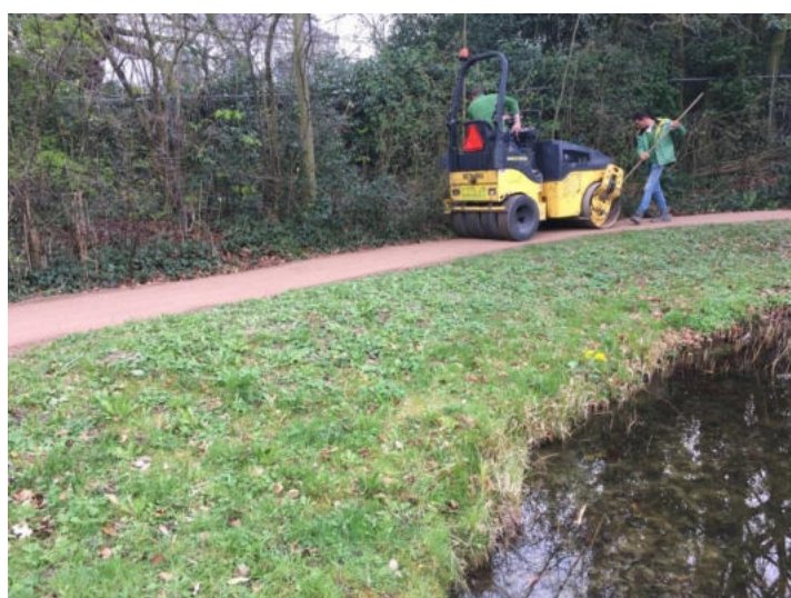
aanleggen van leempaadjes