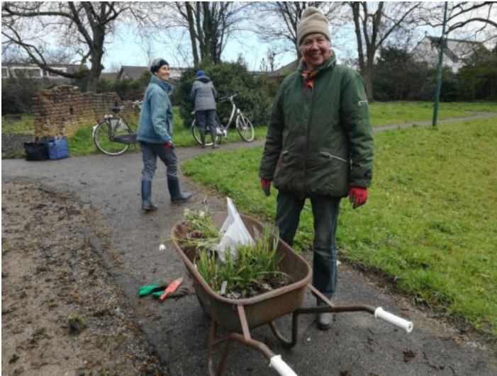
de plantjes in de kruitwagen