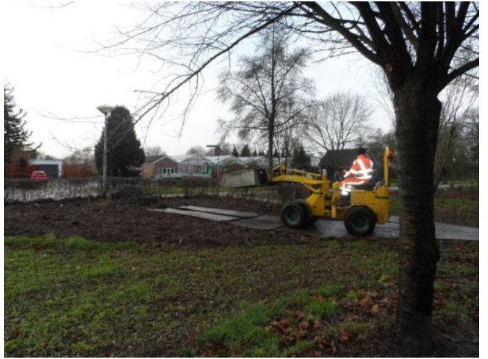
de bramen naast de akker worden verwijderd