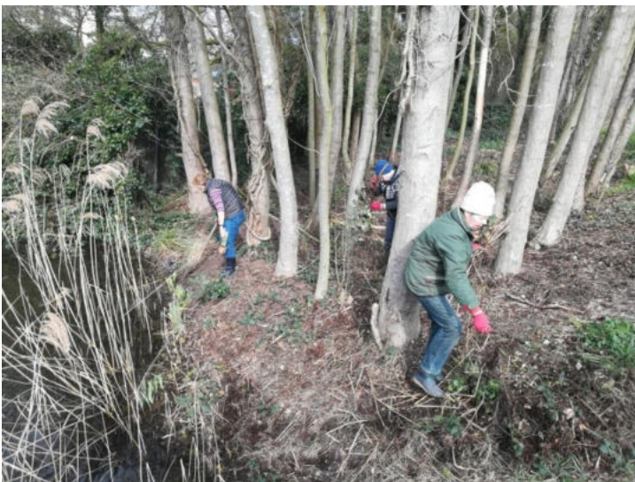
in het elzenbroekbos