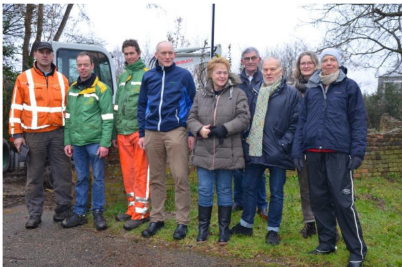
de aanwezigen namens de Gemeente en de Vereniging Natuur en Milieu