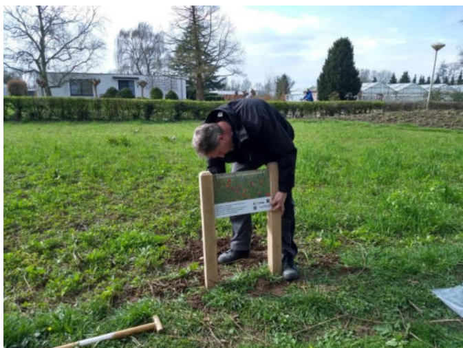
een informatiebordje bij de akker

28 maart : niet onze vrijwilligers, maar anderen aan het werk.