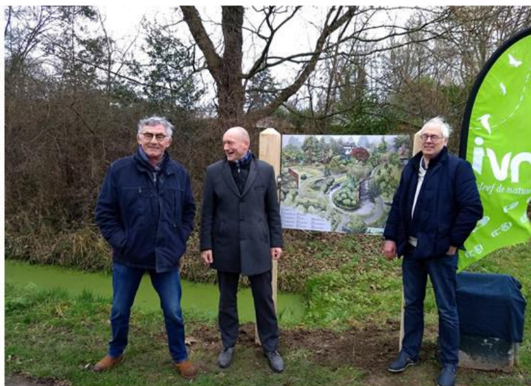
Heemtuin in vogelvlucht