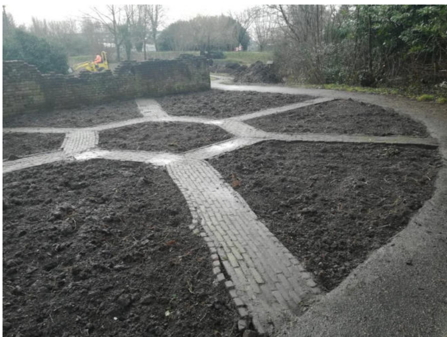
geen kruiden meer, geen haagjes, de start voor de nieuwe aanleg van de kruidentuin