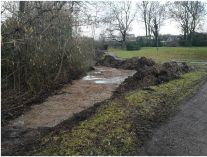
het afgeplagde deel van het natte hooiland