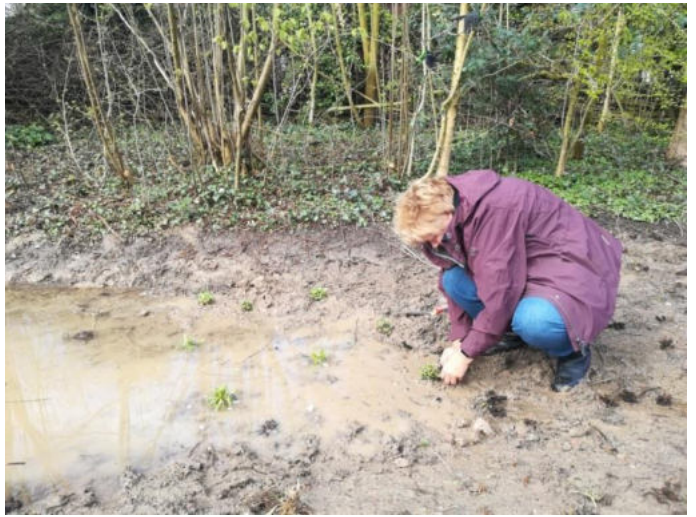
plantjes in het natte hooiland