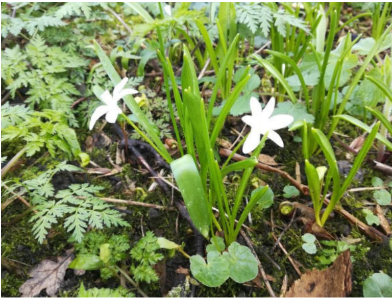
van alles in bloei in de stinzenhoek